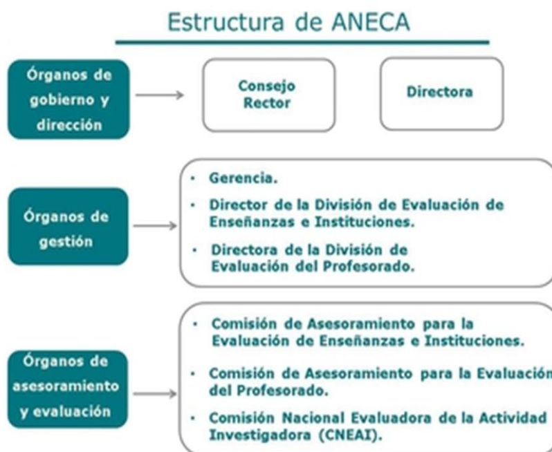
Estructura de la Agencia Nacional de Evaluación de la Calidad y Acreditación