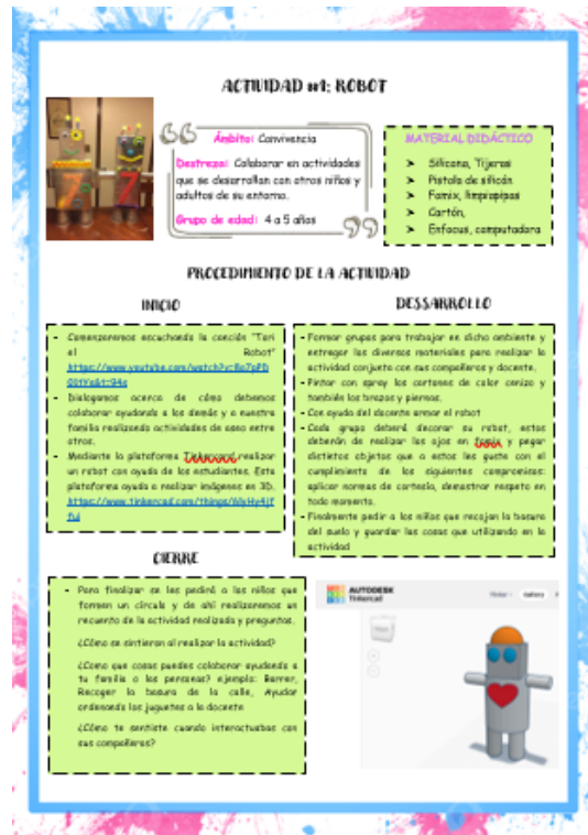
Imagen de la actividad diseñada