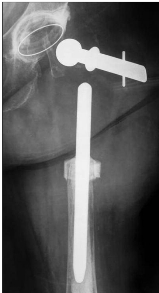
Figura 2. Falla del implante por rotura del polietileno (abril de 2009).