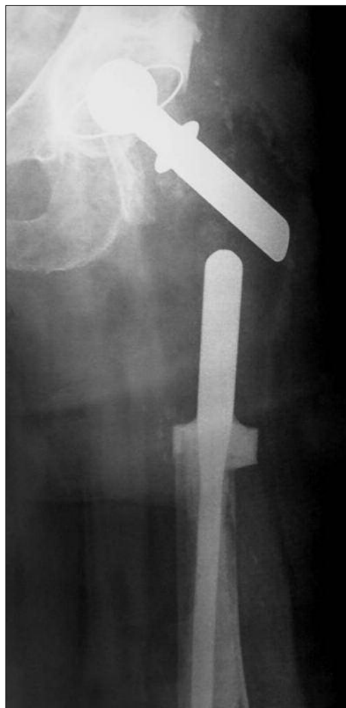
Figura 4. Control radiográfico en el posoperatorio inmediato.