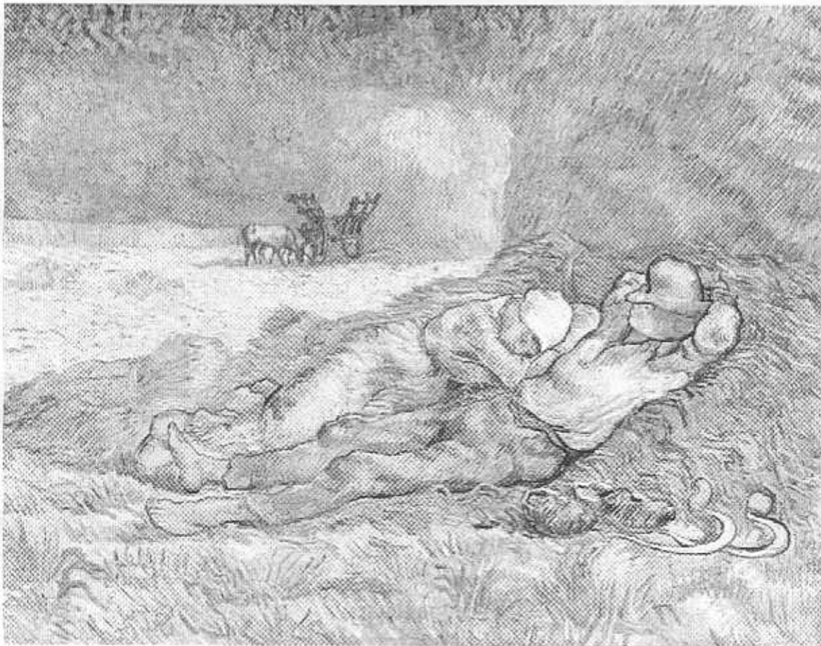
Campeñinos durmiendo la siesta