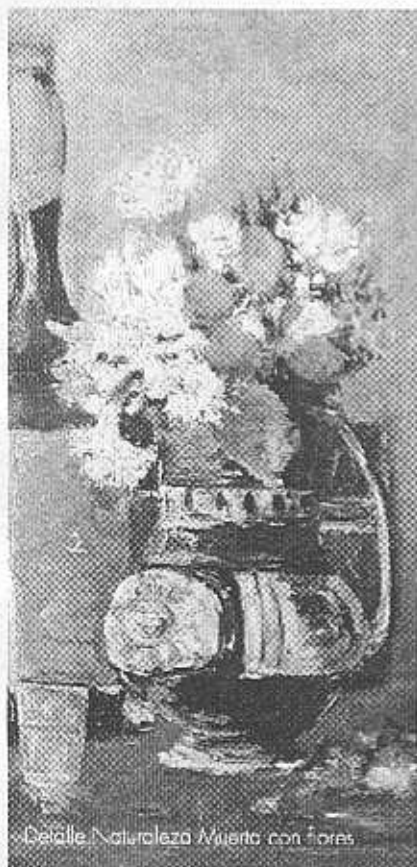
Detalle. Naturaleza Muerta con flores