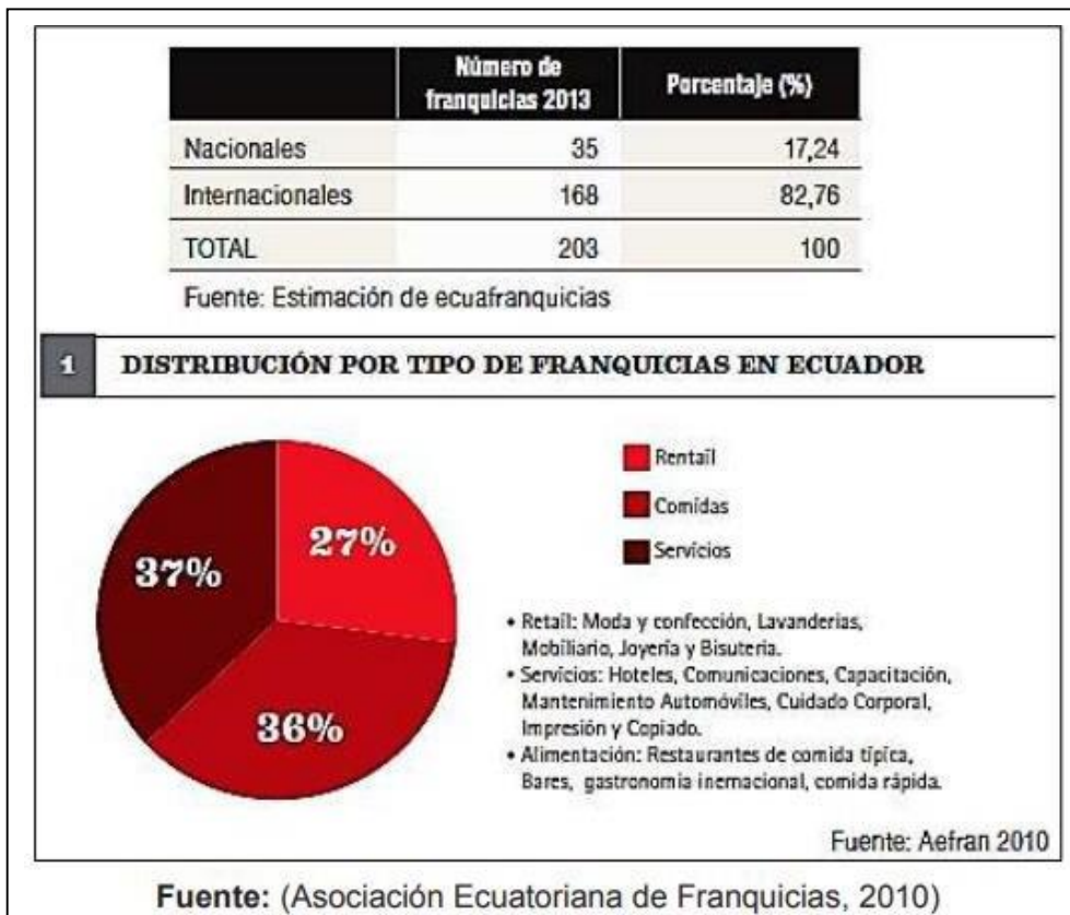
Imagen N° 3: Tipos de franquicias en Ecuador