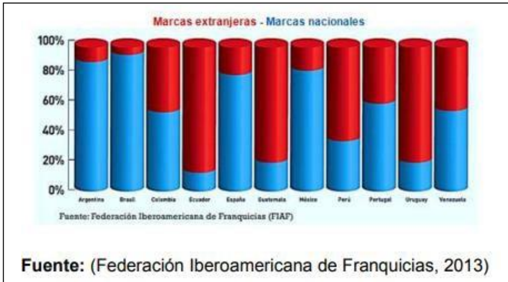
Imagen N° 1: Origen de marcas