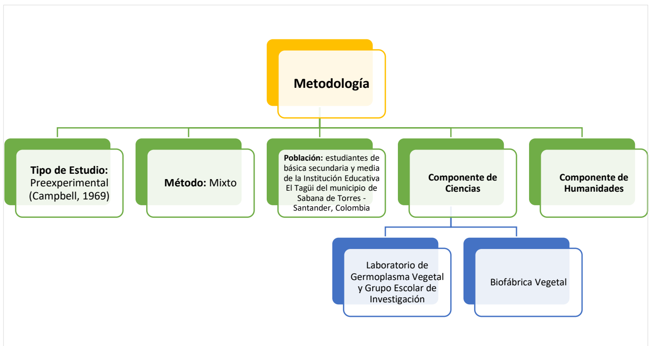
Figura 1. Sistematización del diseño metodológico.