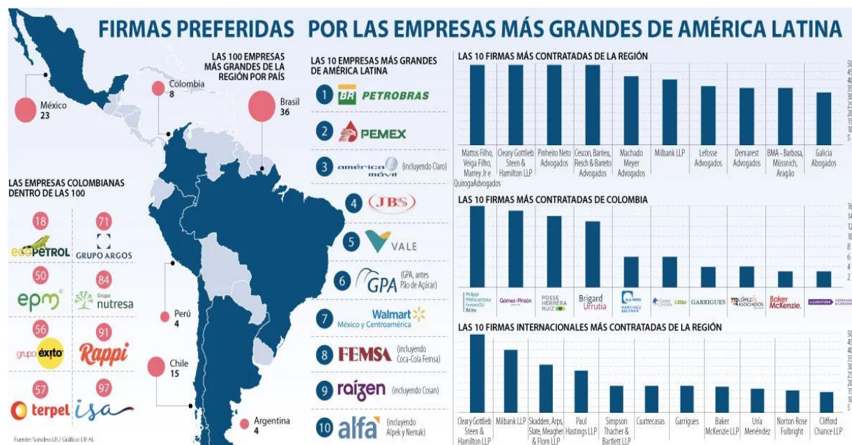
Gráfica 4. Relación de firmas preferidas por las empresas más grandes de América Latina