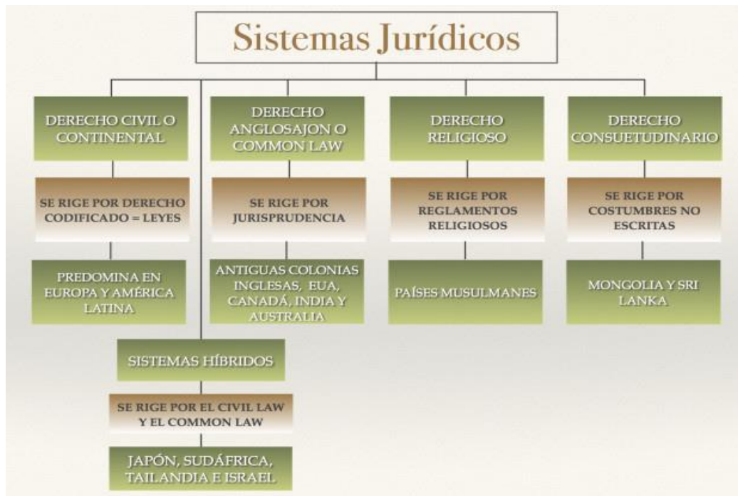
Gráfica 1. Sistemas jurídicos