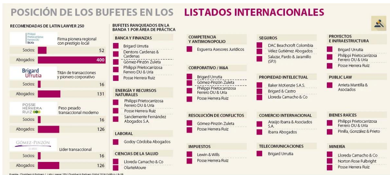
Gráfica 2. Posición de los Bufetes de abogados en listados internacionales

La división en que se encuentra el sector con respecto al tema agrario y agropecuario a su vez que, con alusión a la explotación del suelo y extracción de recursos del suelo, debe ser un trabajo de permanente estudio para efectos de comprender las implicaciones jurídicas de la legislación nacional e internacional materializada por fuentes propias del derecho o fincadas en reductos complementarios como los tratados de libre comercio. En su defecto, el sector debe reconocer en la estructura jurídica que lo identifica como uno de los más problemáticas por lo que implica el acceso a la propiedad, la tenencia y los derechos reales creados al margen de esta, además, de la diáspora social creada bajo dichos trámites en sí.