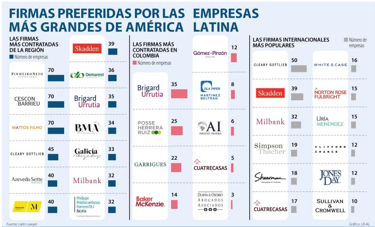
Gráfica 5. Relación de firmas más contratadas.