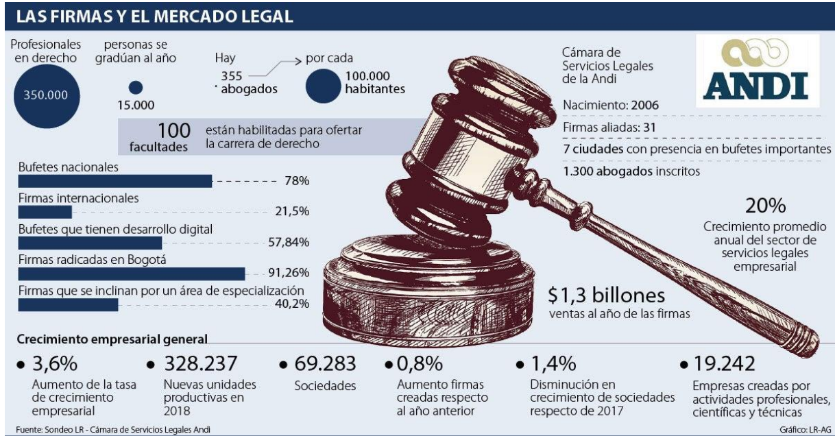
Gráfica 7. Las firmas y el mercado legal

jurisprudencia elementos de trabajo con los cuales poder organizarse o, para convertirlos en pautas de trabajo para sus incesantes dislocaciones.