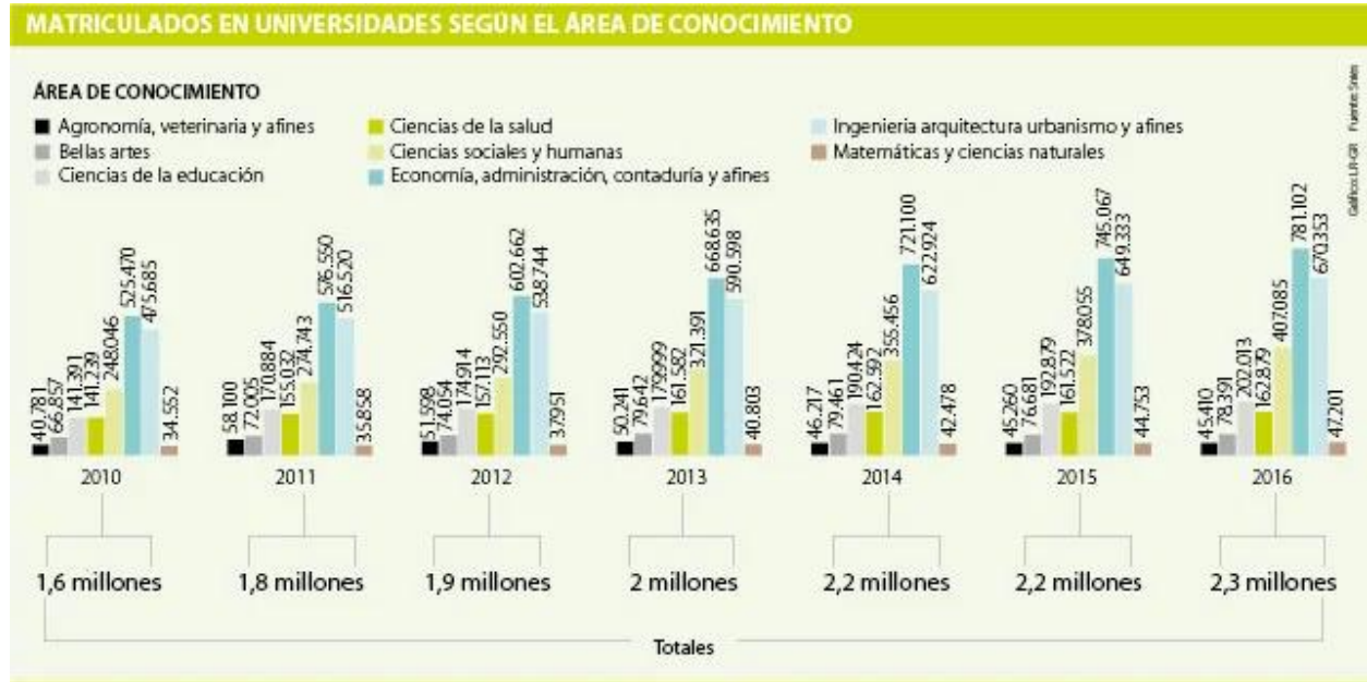
Gráfica 3. Relación de matriculados en universidades según área de conocimiento

Fuente: (Becerra, noviembre 15 de 2018).