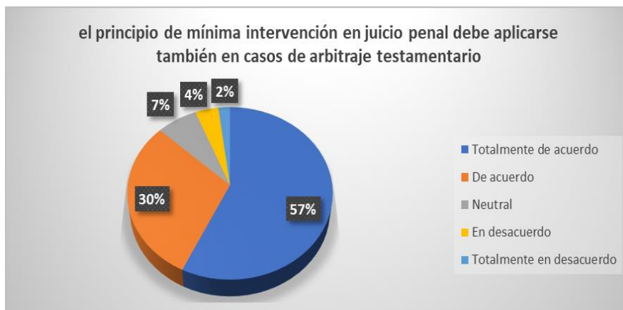
Figura 2. Principio de intervención.