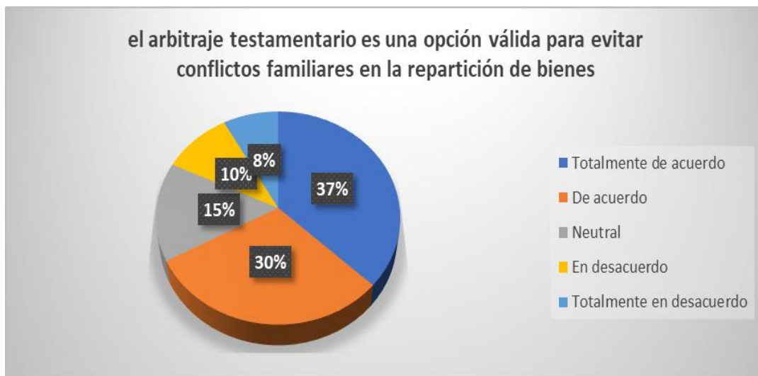
Figura 1. Arbitraje testamentario. Elaboración: Los autores.

1. ¿Considera usted que el arbitraje testamentario es una opción válida para evitar conflictos familiares en la repartición de bienes?