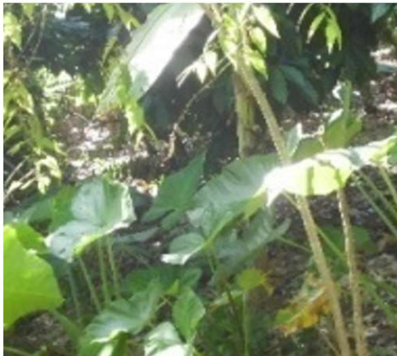
Figura 2. - Representación del cultivo de malanga + cacao intercalado en el sistema agroforestal

Por otro lado, la malanga y el frijol gandul fue la de menor eficiencia con valores similares, aunque con rendimientos favorables y buena complementación fisiológica respecto al cultivo del cacao como se muestra en la Figura 2, para el cultivo de la malanga (Figura 2).