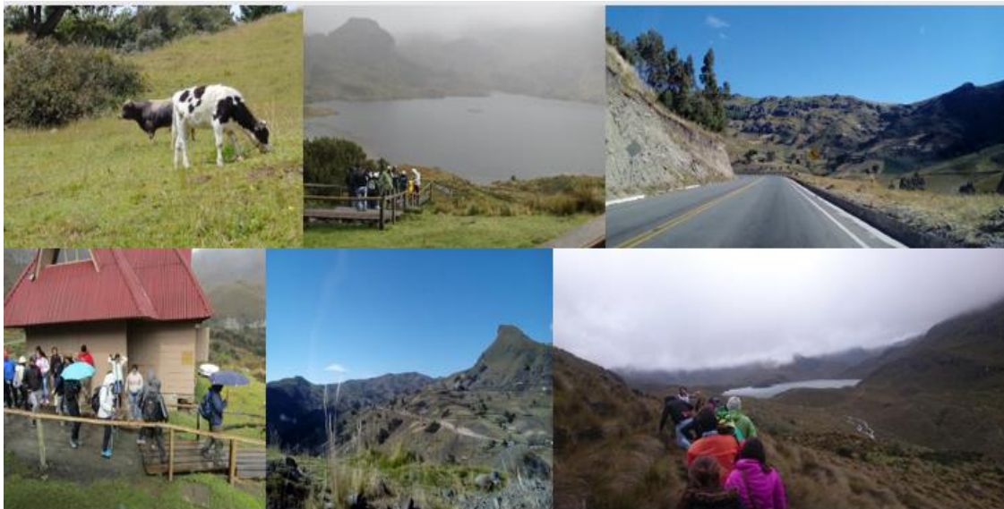
Figura 3. Mosaico de actividades y paisajes del Parque Nacional Cajas

Pese a los bajos niveles de densidad población y su alta dispersión en el territorio, las comunidades locales ejercen presión sobre los recursos naturales tanto fuera como en el interior del Parque Nacional. En el caso de la zona de influencia, el avance de la frontera agrícola y la transformación de los páramos en áreas de pastizal están impactando negativamente sobre la vegetación. En el interior del Parque las actividades que presentan impacto negativo tienen relación más directa con la ganadería intensiva, la pesca deportiva, los incendios forestales y el mal manejo de los flujos turísticos que generan visitas desorganizadas y sin registro. A continuación, se presenta un mosaico de imágenes del paisaje y actividades características del territorio del parque nacional del Cajas (figura 4).