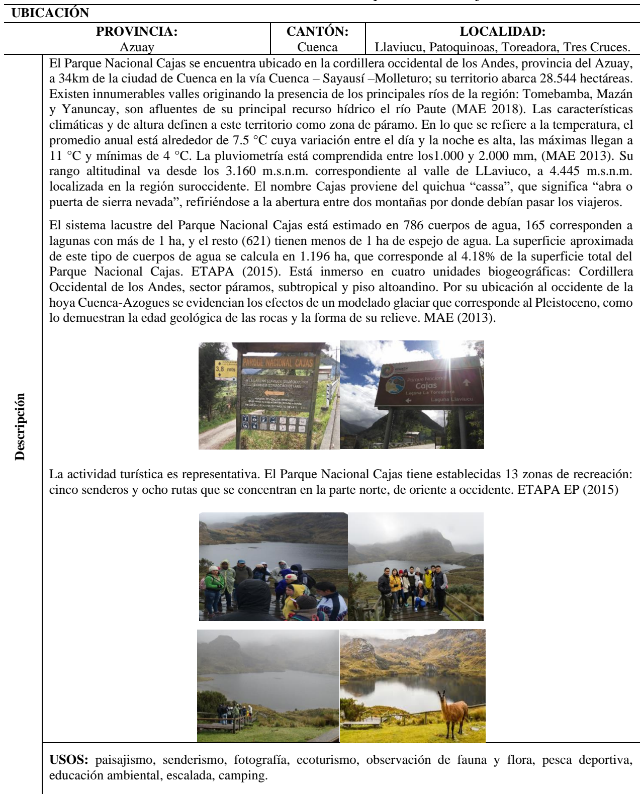
Tabla 1. Ficha caracterización Parque Nacional Cajas.