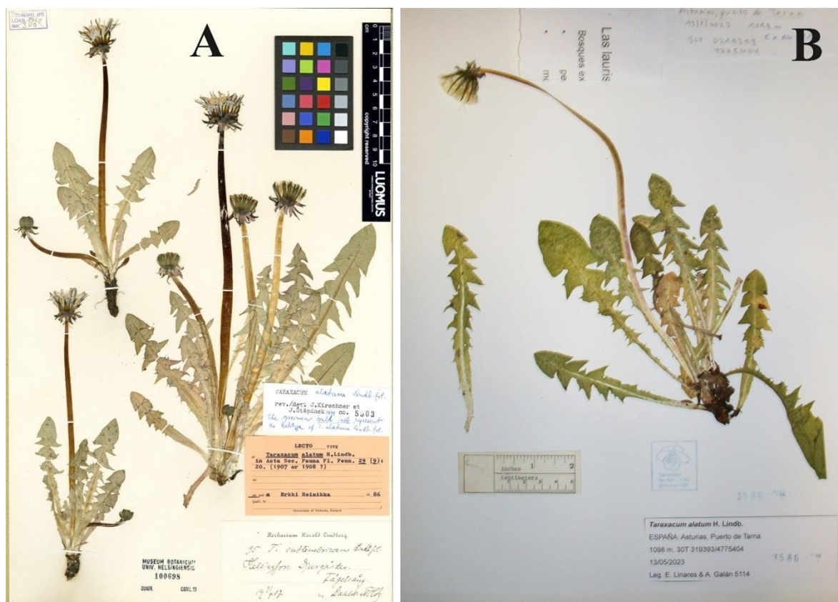
Figura 4. Taraxacum alatum H. Lindb. (A) material tipo conservado en el herbario de la Universidad de Helsinki (H 100698); (B) material de Asturias (USP 3586).