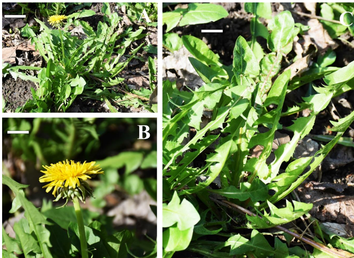
Figura 7. Taraxacum subhamatum M. P. Christ. (A) planta en su hábitat (barra = 30 mm); (B) detalle del capítulo con las brácteas externas de recurvadas a reflejas (barra = 10 mm); (C) hojas mostrando el lóbulo terminal de triangular a sagitado (barra = 10 mm).

Lo hemos encontrado formando poblaciones en céspedes antropizados, al igual que ocurría con las localidades ya conocidas del centro peninsular (Galán de Mera & Linares Perea, 2022), aunque también puede formar parte de pastizales húmedos del norte ibérico, como sucede en el resto de Europa (Dudman & Richards, 1997).