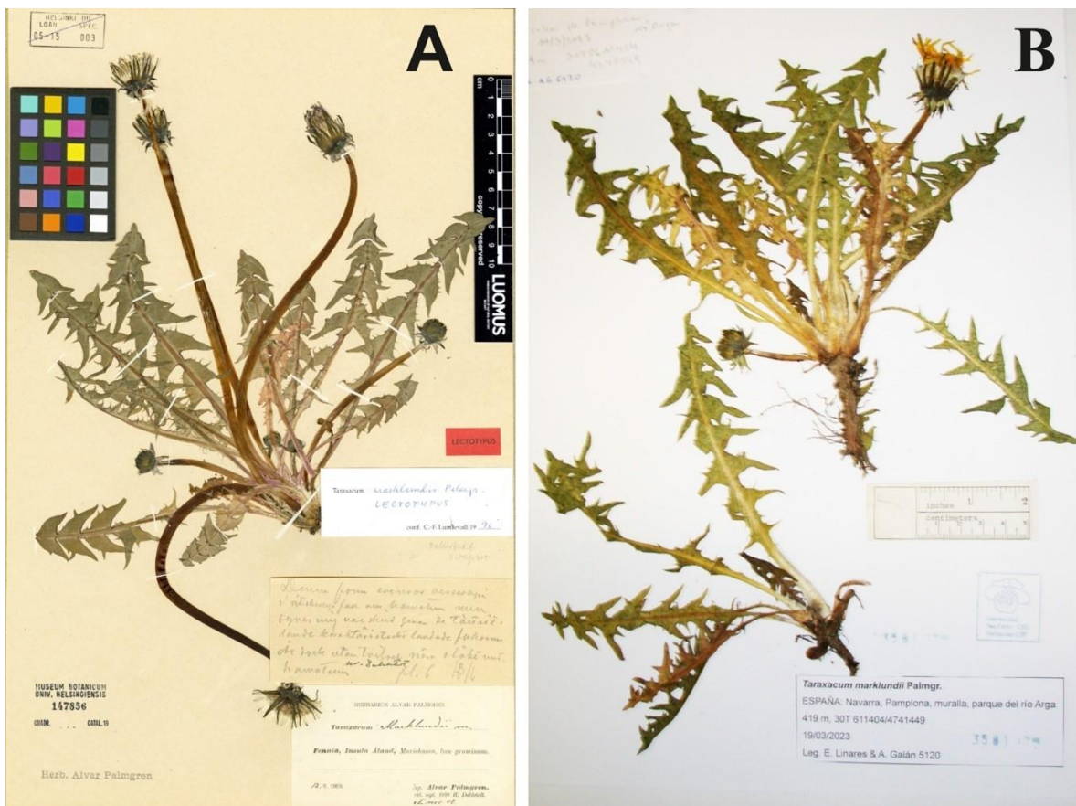
Figura 6. Taraxacum marklundii Palmgr. (A) lectótipo conservado en el herbario de la Universidad de Helsinki (H 147856); (B) Material de Navarra (USP 3581).

Se trata de una especie presente en toda Europa (Richards & Sell, 1984; Kirschner et al. , 2023). En la península ibérica se distribuye sobre todo por territorios con elevada oceanidad (Galán de Mera, 2017), a los que se añade esta primera cita de Navarra, que procede de los céspedes húmedos antropizados de un parque periurbano, con una ecología semejante a la que señalan Dudman & Richards (1997) para las islas británicas.