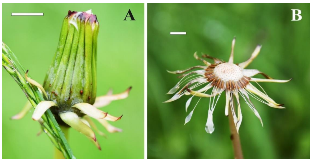
Figura 3. Detalles de Taraxacum alatum H. Lindb. (A) capítulo cerrado por la lluvia mostrando las brácteas externas del involucre (barra = 3 mm); (B) receptáculo con frutos con vilano cerrado por la lluvia (barra = 6 mm).