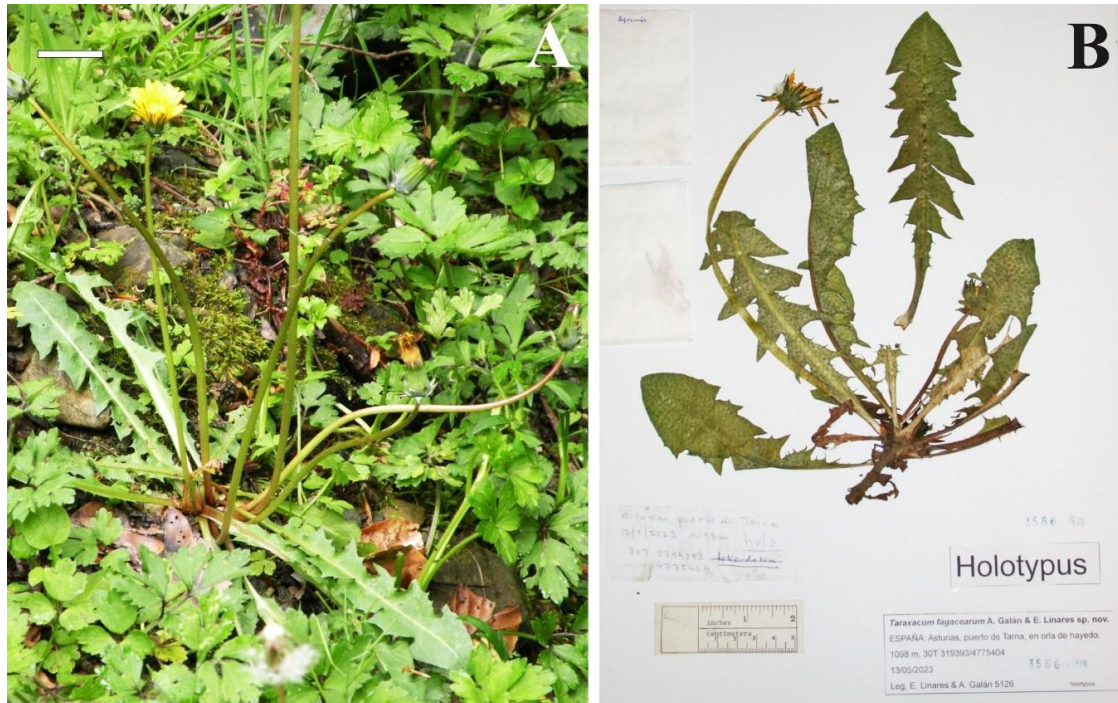
Figura 1. Taraxacum fagacearum A. Galán & E. Linares sp. nov. (A) planta en su hábitat (barra = 20 mm); (B) Holótipo (USP 3566).

enteramente amarillas con los lóbulos del ápice anaranjados. Anteras amarillas. Granos de polen de 6,25-12,5 \mu\text{m} , irregulares. Ramas estilares discoloras, amarillo-púrpuras. Aquenios de color pajizo a verde-oliva; cuerpo 3-3,7 mm, con escuámulas erosas y espículos cortos hacia el ápice, el resto liso con las costillas más o menos anchas; cono 0,5-0,6 mm, sub-cilíndrico; pico 6,1-8,9 mm, de pajizo a verdoso. Vilano 4,6-7,1 mm, concoloro, blanco.