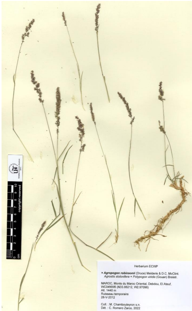
Figure 5. × Agropogon robinsonii : Monts du Maroc Oriental (Om-3), au sud de Debdou: Sidi Ali Belkassam (28-V-2012; N33.88212, W2.97096).

Monts du Maroc Oriental (Om-3), au sud de Debdou: Sidi Ali Belkassam (N33.88212, W2.97096), 1440 m, ruisseau temporaire, 28-V-2012, M. Chambouleyron s.n. (ECWP) (Figure 5).