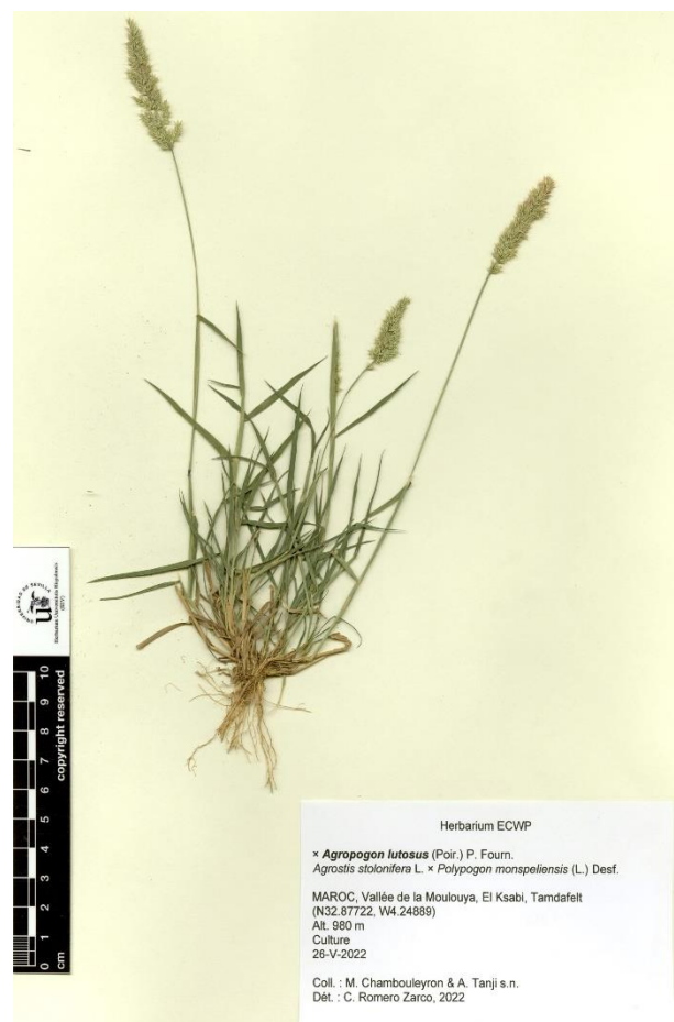
Figure 4. × Agropogon lutosus : Vallée de la Moulouya (Op-2), El Ksabi, Tamdafelt (26-V-2022 ; N32.87722, W4.24889).