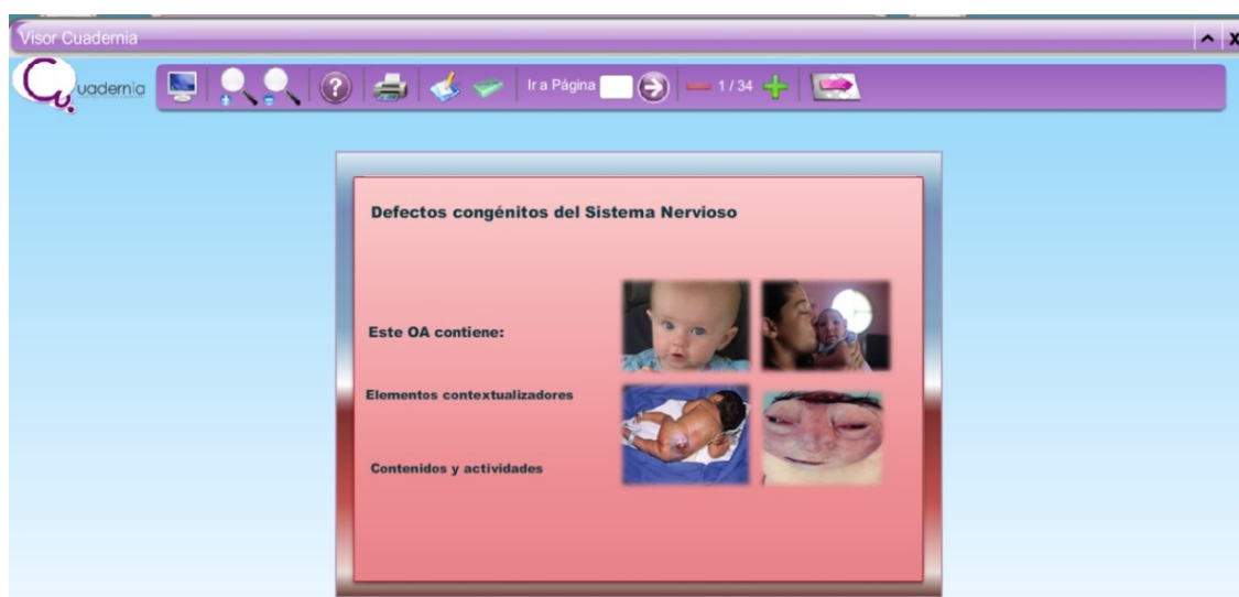
Fig. 1. Interfaz Inicio del OA. Defectos congénitos del sistema nervioso

La página principal de este OA consta de dos bloques: elementos contextualizadores y contenidos y actividades, como se muestra en la Figura 1.