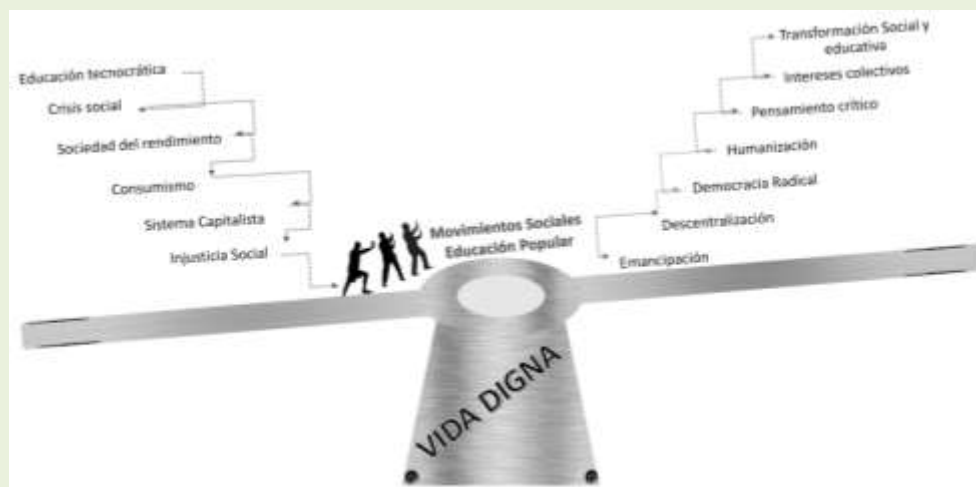
FIGURA 1 - Transformar y renovar para inclinar la balanza

característica de la crisis mundial. Del mismo modo se presenta de manera gráfica el impulso que deberán promover dichos movimientos sociales y educación popular, los cuales bajo un trabajo coordinado surgen como una esperanza para inclinar la balanza. De manera que, bajo los principios emancipadores que se visualizan al lado derecho, sea posible rescatar el reconocimiento del ser humano y en definitiva lograr una vida más digna para todos.