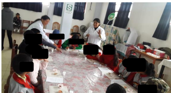
Figura 2 Aplicación de la escala de aceptabilidad en IE Santa Elizabeth

En la figura 3, se puede observar que, de acuerdo a los resultados de las encuestas, el sabor presenta un