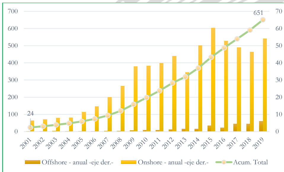
Gráfico 1: Evolución de la capacidad instalada anual y total, 2001-2019 (en GW)

Fuente: Elaboración propia en base al GWEC (2020).