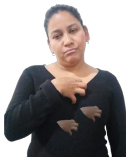
Figura 1 – Sinal 'SAUDADE' em LSV