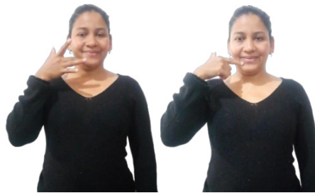
Figura 3 – Sinal híbrido (LSV e Libras) para a palavra DELÍCIA

ponto de articulação. Se diferenciam, de forma mais evidente, pela configuração de mão e o pelo movimento que, na Libras, é retilíneo da direita para a esquerda e, na LSV, há além do movimento idêntico ao da Libras, um movimento da esquerda para a direita. Maryha inicia o sinal em Libras (com movimento da esquerda para a direita) e termina em LSV, com movimento em sentido contrário e com uma mudança na configuração de mão, como na Figura 3.