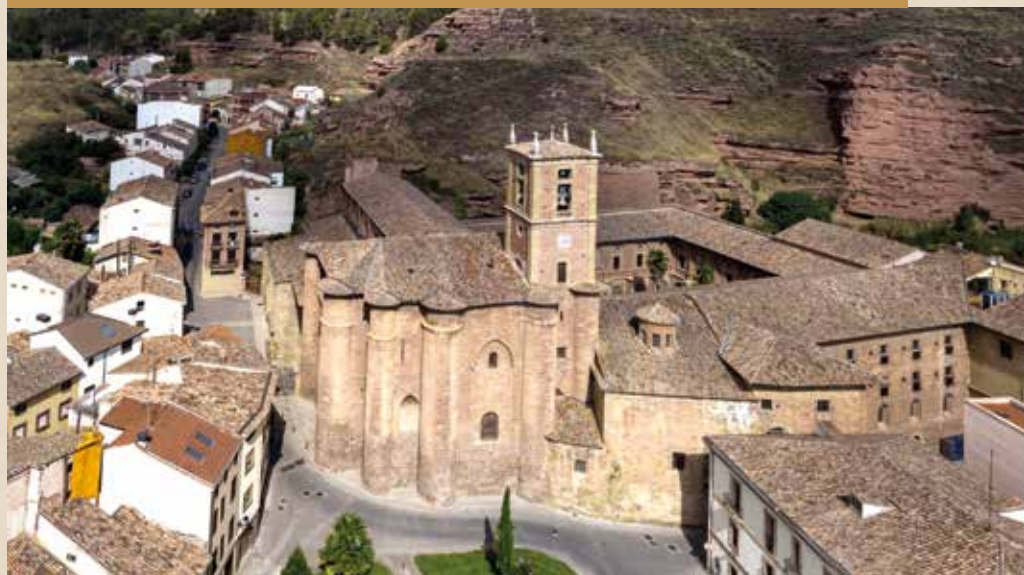
Basilica y monasterio de Santa María la Real de Nájera

El origen del litigio queda claro desde el inicio del documento: “Salud e gracia. Sepades que ante Nos, en el nuestro Consejo, por parte del capiscol, curas e clerigos de la iglesia de Santa Maria de la villa de Puerto, ques cerca de la vila de Laredo, fue presentada una petiçion por la cual dixieron que la dicha iglesia, con sus anexos de onor eran de nuestro Patronazgo, e que Nos perteneçia la provision de