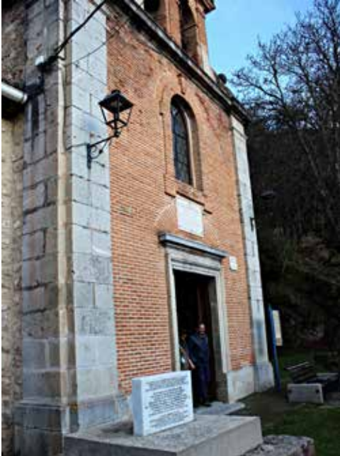
Placa conmemorativa de la Jura junto a la ermita de Los Nogales

recogiendo este acontecimiento en el informe correspondiente a Villanueva.