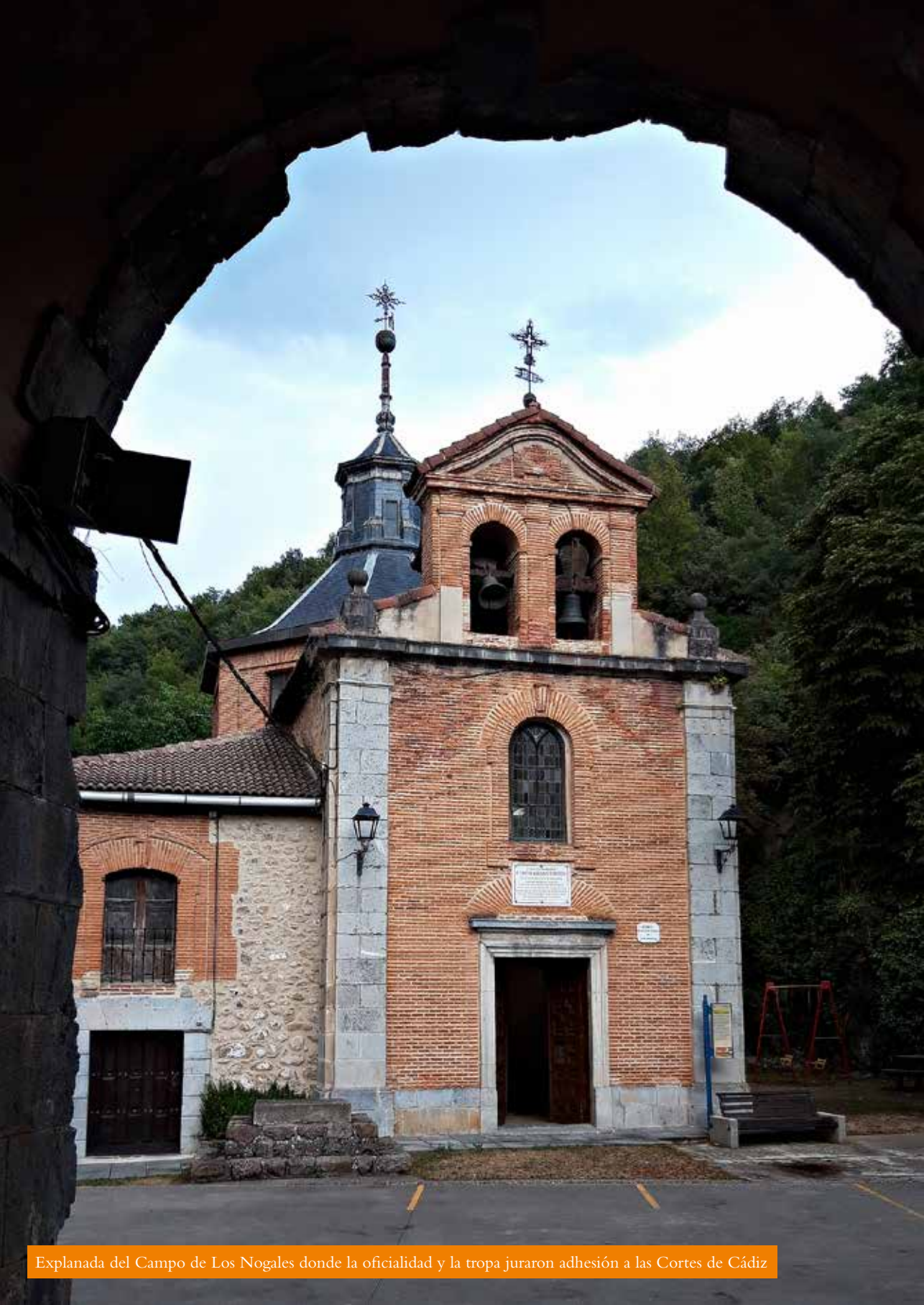
Explanada del Campo de Los Nogales donde la oficialidad y la tropa juraron adhesión a las Cortes de Cádiz