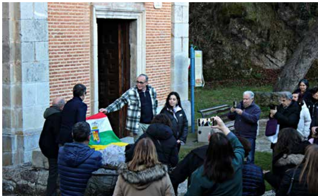
El presidente de La Rioja y el alcalde de Villanueva descubren la inscripción conmemorativa

cinco de cada una, añadiendo que las tres cuartas partes son pastores de ganado trashumante, jornaleros y pobres. Sitúa la villa a nueve leguas de Soria, capital de la provincia, y ocho de Logroño. Es cruce de caminos entre diversas ciudades y pueblos, “motivo por el que ha sido más frecuentado que otros pueblos tanto por las tropas de la nación como por las enemigas y, por tanto, ha padecido mucho más”.