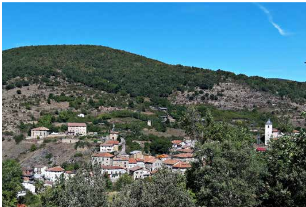
Villanueva de Cameros en el valle del Iregua

Revista El Pirino , nº 23, agosto 2013, pp. 6 y 7, edit. Amigos de Villanueva de Cameros.