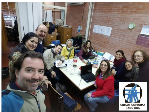
Figura 7. Foto del Equipo CIBAUT - COPROMA – (2019) Arquitectos: Martín Giordano; Alejandra Alvarez; Claudio Benardelli, Adriana Apollonio; Sergio Placeres; María Nélide Galloni; Gisela Urroz; Diseñadora Gráficas: María Eugenia Godoy; Diseñadora en Imagen y Sonido: Florencia Romero; Diseñadora Industrial: Melina Izcovich.