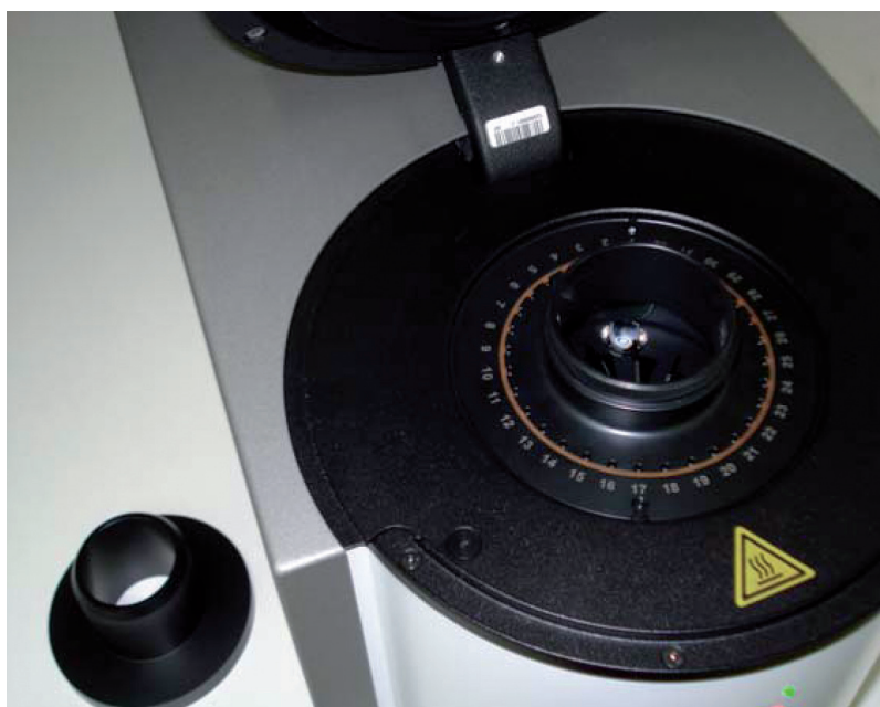
Figura 1. Equipo PCR en tiempo real.

La reacción en cadena de la polimerasa (PCR por sus siglas en inglés) es un método que permite la amplificación o la creación de múltiples copias del fragmento de ADN que se quiere estudiar. En el caso de la búsqueda del sexo fetal en sangre materna, se trata de amplificar fragmentos del cromosoma Y, marcarlos con un colorante y cuantificar la fluorescencia emitida por el colorante. La PCR en tiempo real se usa en otras áreas de medicina para medir la carga viral, detectar agentes infecciosos, verificar la expresión de ciertos genes, controlar la eficacia de fármacos, entre otros.