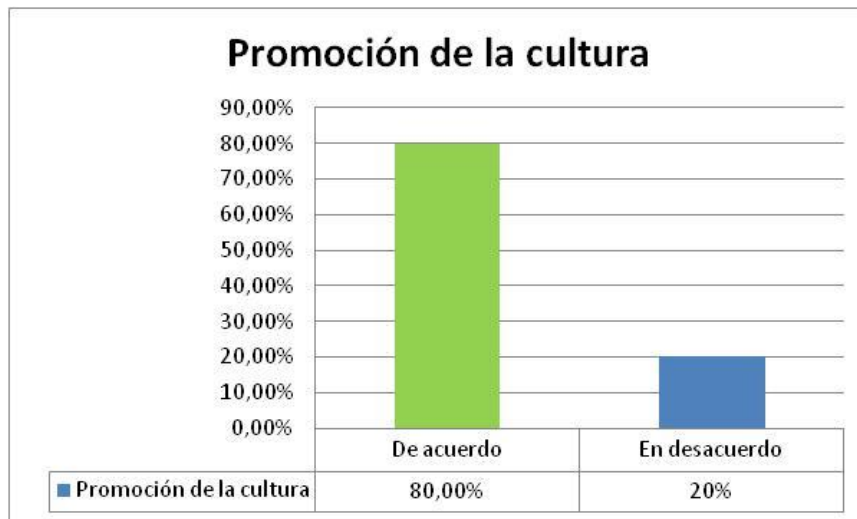
Figura 2. Promoción de la cultura. Elaborado: Los autores.