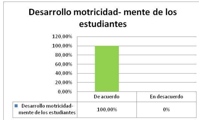
Figura 3. Desarrollo motricidad- mente de los estudiantes.