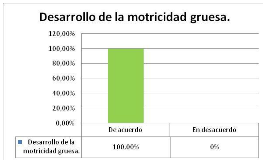
Figura 5. Desarrollo de la motricidad gruesa.

En la figura 4, 50% de los docentes estuvieron de acuerdo al señalar mejoras significativas en las habilidades motrices finas de los niños participantes con la aplicación de los juegos tradicionales. Por su parte, un 50% no estuvo de acuerdo, debido a que consideraron que las habilidades motrices finas se desarrollan mediante actividades más sencillas y manuales. Sin embargo, los docentes que presentaron su acuerdo argumentaron que los juegos tradicionales ayudan de forma óptima en la estimulación de la motricidad fina.