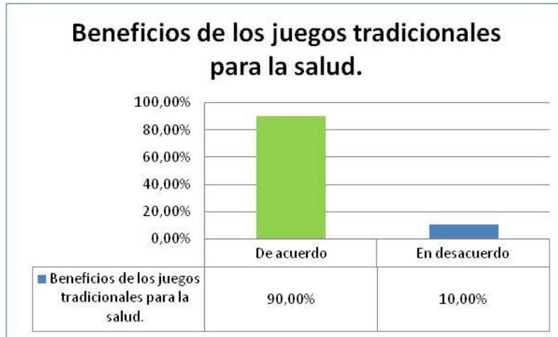
Figura 1. Beneficios de los juegos tradicionales para la salud. Elaboración: Los autores.

estudiantes, el desarrollo de la motricidad fina, el desarrollo de la motricidad gruesa, la integración de los valores sociales y el juego como estrategia fundamental.