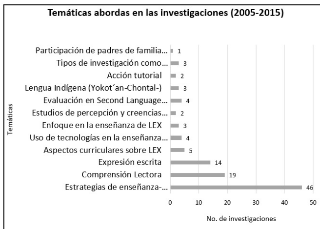
Figura 3. Categorización de las temáticas abordadas en las investigaciones

Para categorizar las temáticas que se incluyen en la Figura 3, inicialmente se analizaron los títulos para identificar variables, mismas que se relacionaron con los objetivos y preguntas de investigación, así como con los diseños metodológicos de cada investigación. Se leyeron 106 temáticas, se clasificaron con base a diferencias y similitudes conceptuales. Luego se reagruparon hasta lograr las 12 categorías en las que se organizaron; véase Figura 3. En él se observa la recurrencia de 4 importantes áreas relacionadas con el tema común de lenguas (lengua española, inglesa, italiana, francesa y chontal). I. “Estrategias para la enseñanza y aprendizaje de lenguas” con un 43.3%. II. “Comprensión lectora” con el 17.9% (19) y “Expresión escrita” con el 13.2%.