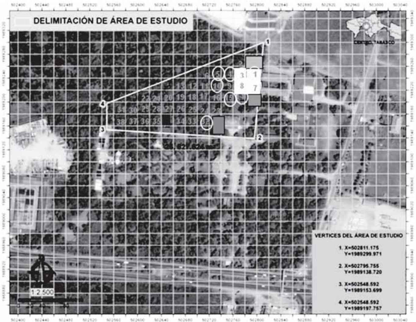
Figura 1. Ubicación de la zona inundable de Tinto, □ = Biblioteca, □ = Baños, □ = Cafetería, ⊙