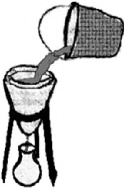
Imagen 3. Captación de Comunidades Rurales

Otra manera de captación del agua de lluvia utiliza un material llamado barro tinajas el agua de lluvia pasa directamente por la boca de este recipiente al cual se le ha colocado un filtro casero que protegerá el agua de impurezas o basura (Imagen 4).