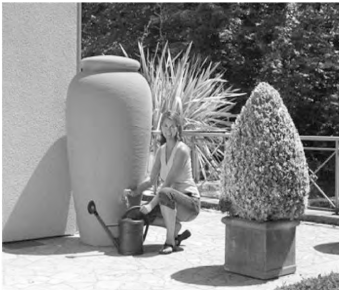
Imagen 4. Tinajas De Barro

Otra solución más sencilla y barata para el aprovechamiento del agua de lluvia es el suministro para riego. Adaptando un filtro al canalón y sencillamente se conecta a un depósito, y dispone