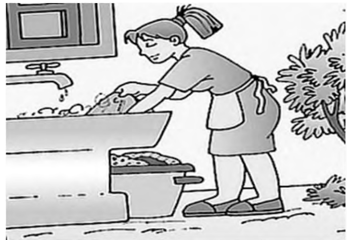
Imagen 5. Aprovechamiento del Agua.

En nosotros esta el buen uso del agua, no desperdiciemos la oportunidad de aprovecharla, convirtamos el agua de lluvia en una mejor opción de mejorar nuestra manera de vivir y beneficiemos a quienes no cuentan con este recurso.