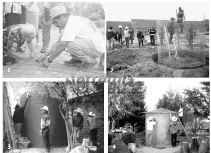
Imagen 2.1 Elaboracion de Cisterna de Ferrocemento.