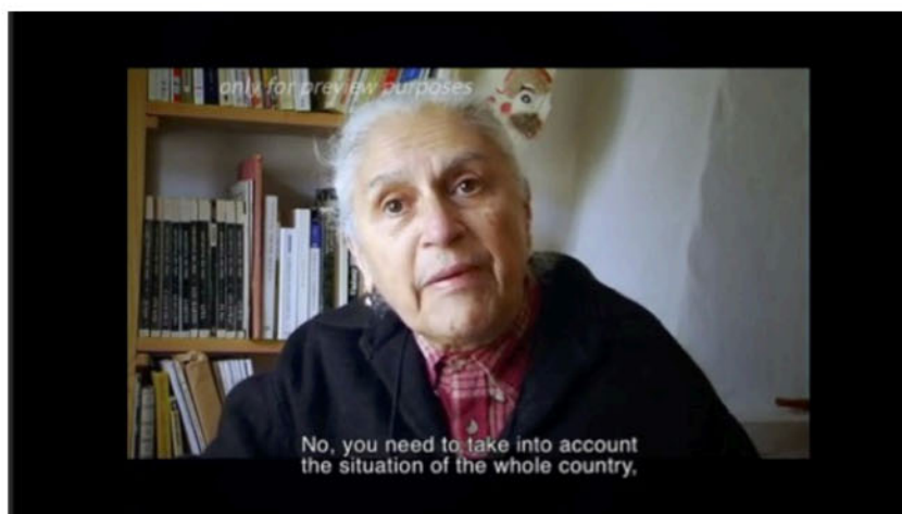
Fig. 5 - Sibila - Embate com o antecampo

pessoa extremamente firme e leal aos seus ideais. E que, apesar das insistências e visões opostas de Teresa, se mostra aberta ao diálogo e à construção do encontro no documentário.