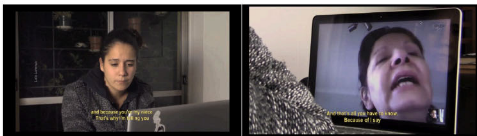
Fig. 6 e 7 - O pacto de Adriana - Embate

Dado que a maioria dos encontros em O pacto de Adriana são mediados por telas ou câmeras, o embate não seria diferente. A cena é registrada por duas câmeras, (1) uma registra Lissette e suas reações em plano médio e a (2) outra, a tela do computador, com Chany via webcam (e o braço/presença de Lissette).