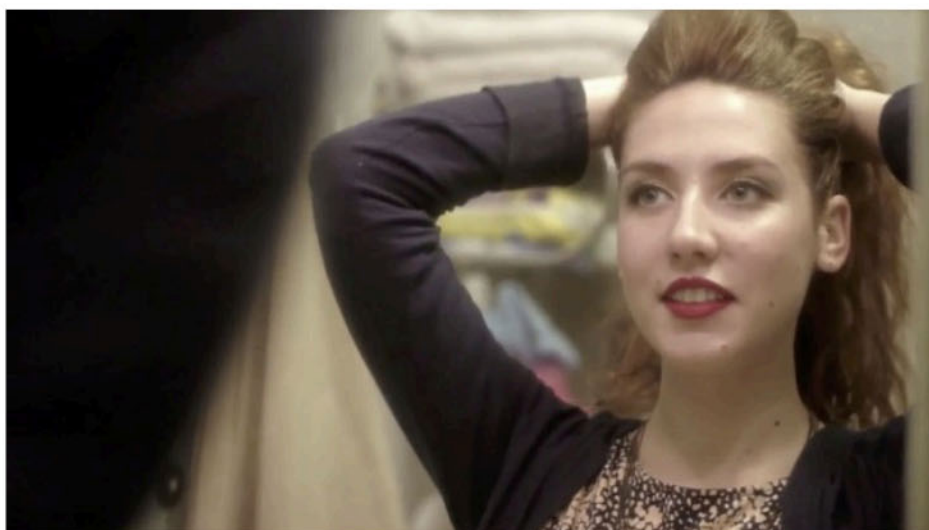
Fig.4 - Las Lindas - Registo pelo reflexo do espelho