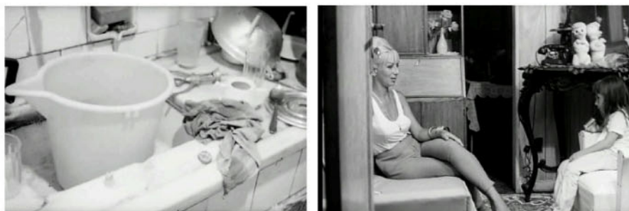
Fig. 8: Frames de A opinião pública , 1967