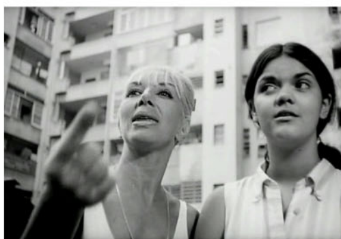
Fig. 4: Frame de A opinião pública , 1967

No meio das moças que expressam suas opiniões sobre amor e paixão, uma mulher madura se destaca pela segurança com que fala, demonstrando domínio no assunto (fig. 4). Dentre seus rasos conselhos sentimentais, diz para as jovens com quem conversa: “Eu conheço moças que namoram rapazes, deixam os rapazes beijar e não gostam deles, isso é que é carnal. (...) Moça que gosta fica em casa, esperando telefonema (...)”