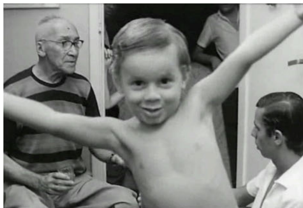
Fig. 2: Frame de A opinião pública , 1967

Outro aspecto relevante a destacar é o grau de centralidade da personagem no documentário. Nem toda personagem expressiva é central no documentário; há as que aparecem circunstancialmente, mas que, muitas vezes, deixam rastros marcantes, embora possam nem se aperceber das relações em jogo. Nesse sentido, é importante relativizar o protagonismo. Elisabeth Teixeira, por exemplo, é o eixo de Cabra marcado para morrer (1984), de Eduardo Coutinho: tudo no filme se volta para ela, é em volta dela que orbitam as histórias, os fatos. No entanto, por vezes, personagens de poucos instantes na tela se incrustam no documentário de tal maneira que marcam o filme em definitivo, seja pela intensidade de sua presença na tomada, seja pelos significados de sua aparição. Nesse sentido, podemos lembrar do pequeno garoto de A opinião pública (1967), de Arnaldo Jabor, aquele que faz caretas e mímicas diante da câmera, enquanto seu provável avô - a personagem que justifica a cena - faz um longo discurso moralista (fig. 2). O garoto aqui não está encenando para compor sua personagem, ele não está instigado por qualquer noção do que representa o realizador e sua equipe. Para ele, aquele é apenas um momento lúdico, lhe interessa fazer gracinhas para pessoas estranhas que ocupam sua casa, sem calcular qualquer efeito que possa causar num eventual espectador.