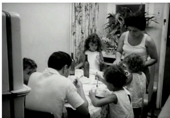
Fig. 6: Frame de A opinião pública , 1967

Acho minha vida chata demais: cuidar dos filhos, cuidar da casa, ir à praia de vez em quando, lavar e passar para o meu marido, levantar de madrugada quando ele chega das farras, botar comida pra ele, isso não é vida. Estou com 25 anos, quando chegar aos 40 nem sei o que será de mim, acho que não boto mais nem a cara na janela.