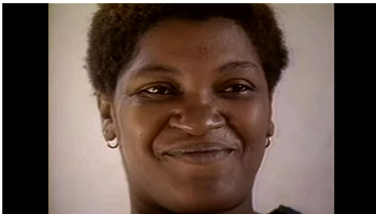
Fig. 1 – Personagem do filme Santa Marta - Duas semanas no morro , de 1987.

Não vão falar mais nada não”. O cineasta diz em tom alegre “Você que sabe, você é quem manda”. “Vamos falar mais um pouquinho”, repete, sinalizando a importância daquela interação para as mulheres da comunidade, uma carência que o dispositivo de Coutinho veio acolher. Infelizmente em Santa Marta não há identificação das personagens, portanto não podemos nomear essa mulher, mas é marcante a força de suas expressões que se destacam pele e sobrevive para além do filme.