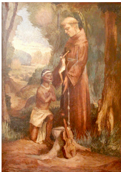
Imagen 2. Autoría sin identificar, (s/f). Sin título (descrita en actas como San Francisco Solano e indígena). Pintura al óleo.

El sacerdote por su parte, posee los atributos de San Francisco Solano: el color característico de la orden franciscana, la sugerencia de un medio halo sobre la parte posterior de su cabeza –símbolo de santidad–, el crucifijo y el violín, que es además un instrumento que refuerza la idea de “civilización” a través del arte y de la felicidad como fin último de la cristiandad. Finalmente, el tronco talado representa la intervención del hombre en la naturaleza y en el contexto chaqueño refería específicamente al trabajo y es elemento central en la relación entre blancos e indígenas en los obrajes de fines del siglo XIX y principios del XX. El autor de esta pintura compone una sencilla alegoría de la fundación cristiana del Chaco acontecida en las primeras incursiones de las órdenes religiosas durante los siglos XVIII y XIX. A partir de los distintos elementos que componen la escena y se conjugan con los discursos de la época, el Chaco está representado por el joven indígena y el sacerdote refiere a la presencia del hombre-blanco-religioso-culto durante el pasado colonial 4 .