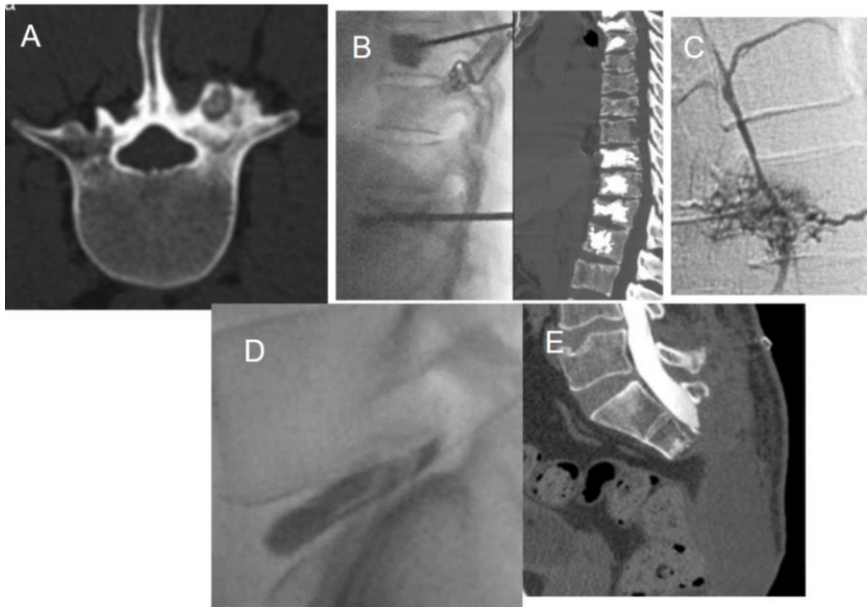
Figura 2. Imágenes de algunas Técnicas radiológicas intervencionistas

A) Ablación tumoral en osteoma osteoide. B) Vertebroplastia en un paciente con metástasis de mama. C) Angiografía, hemangioma del cuerpo vertebral. D) Discografía de un núcleo pulposo contenido por el anillo fibroso. E) Estudio mielográfico para descartar una fístula tras sacrectomía parcial.