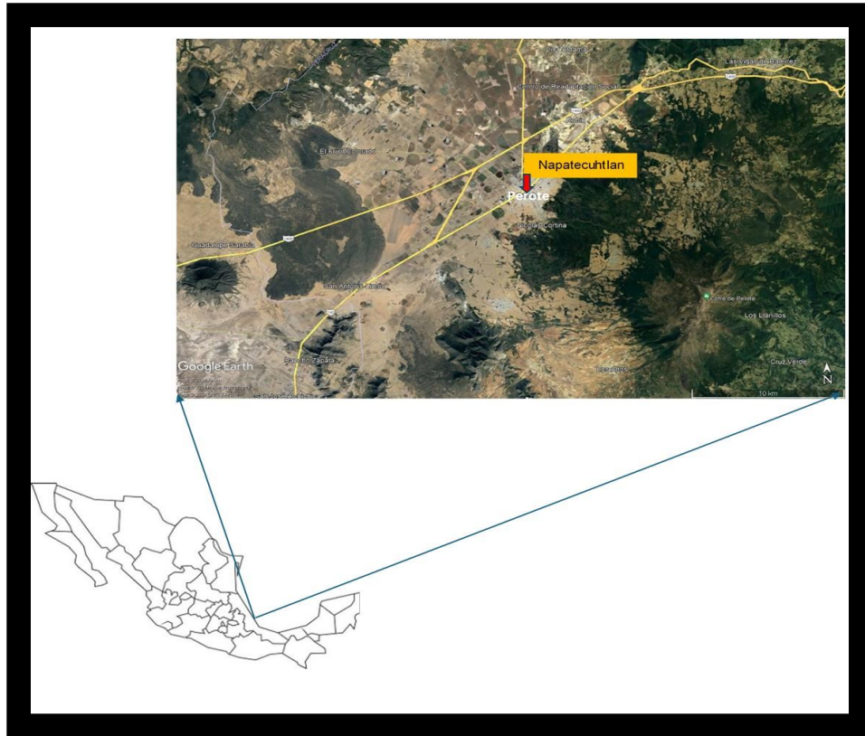
Figura 1 Localización geográfica de Napatecutlan, Perote, Veracruz, México