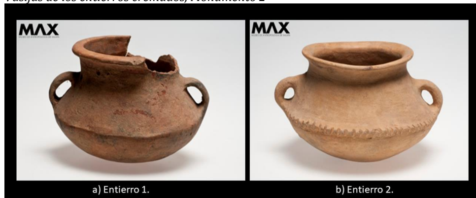
Figura 5 Vasijas de los entierros cremados, Monumento 2

De los 14 entierros que fueron excavados por Medellín en Napatecuhtlán en 1950, en este trabajo solo se analizaron restos óseos humanos de dos 13 , los cuales como parte de su tratamiento funerario fueron cremados, cuyas cenizas y fragmentos fueron colocados en vasijas de cerámicas con materiales con tapas ( Figura 5 ), y depositados en el Montículo 2, junto con cuentas de jadeíta y el hacha votiva ( Figura 4 ), por lo cual se ha considerado se trata de un espacio ceremonial, ya que de acuerdo al tratamiento funerario, la cremación implica tiempo para mantener el fuego, recursos y diferentes personas que puedan llevar a cabo tal evento.