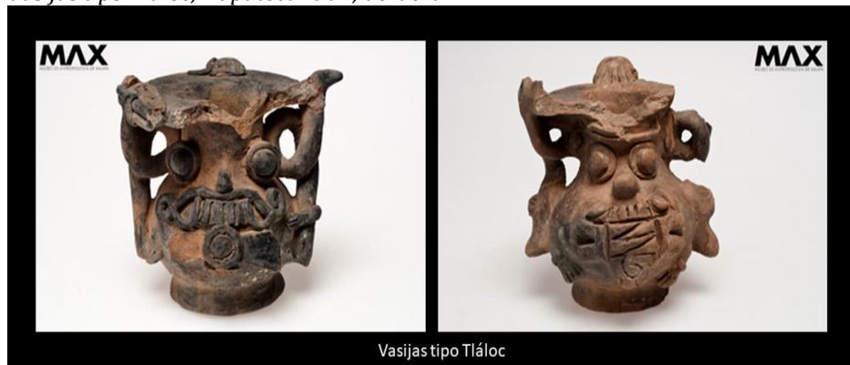
Figura 2 Vasijas tipo Tlálóc, Napatecuhtlan, Veracruz