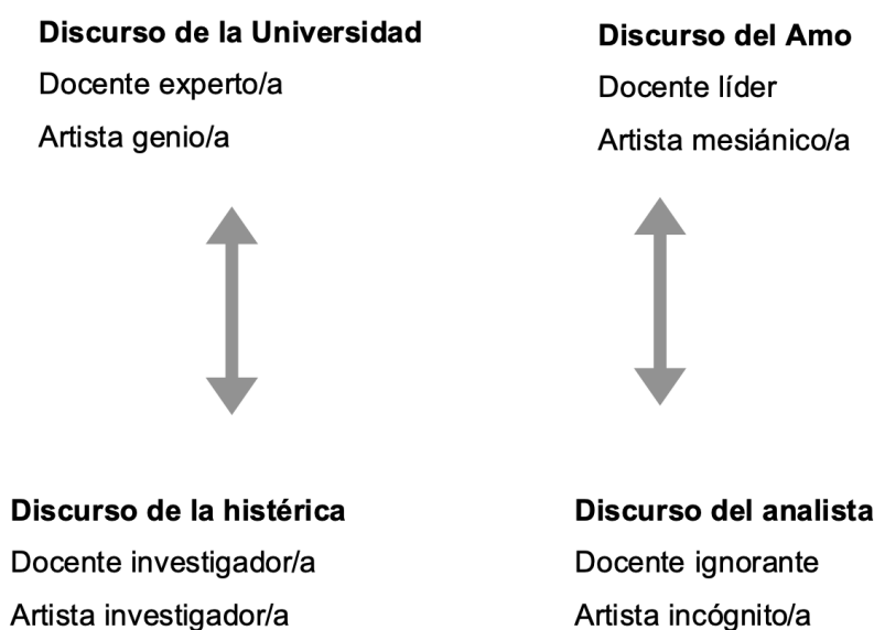
Figura 2. Formulación de los cuatro discursos de Lacan

Aquí ubico la esquematización de los desplazamientos conceptuales y análiticos que se han trazado para conectar cada una de las cuatro formas discursivas con las figuras de artistas y docentes antes descritas, que nos llevan a proponer la noción de disrupción cognitiva como categoría articuladora (Figura 2). Las flechas señalan los “reversos” discursivos que Lacan (2008) plantea y el uso de mayúsculas y minúsculas enfatiza el carácter protagónico o su negación.