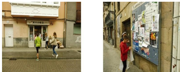
Figuras 6 y 7. Difundiendo el material.

Llamó la atención el buen criterio con el que eligieron las ubicaciones para los pósteres (ver figuras 6 y 7).