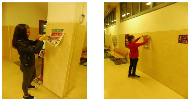
Figuras 4 y 5. Colocando los pósteres en el centro escolar.

Con las últimas versiones de los distintos materiales creados, y como colofón a la propuesta didáctica se procedió a difundir el trabajo realizado. "Salir a la plaza", suponía compartir su trabajo con la comunidad. Nos reunimos con el grupo en un aula para comentar el plan de acción. Disponíamos del tiempo del recreo y de la siguiente hora para colocar los pósteres y distribuir los trípticos durante un recorrido por distintos lugares de la localidad. Preparamos los pósteres con cinta adhesiva de doble cara, y repasamos los lugares previamente elegidos para colocar nuestros trabajos (figuras 4 y 5)