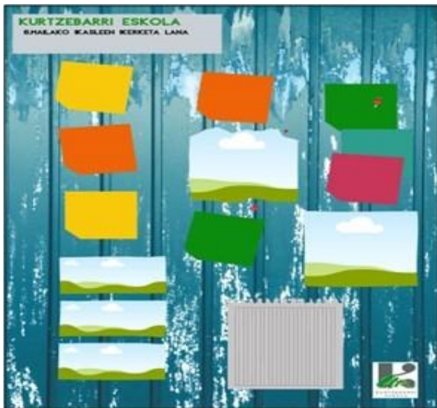
Figura 2. Uno de los modelos de póster

Así, para componer el boceto del póster y del tríptico, contaban con una selección de fotografías de las diferentes fases además de contar con diferentes plantillas diseñadas con el programa "canva" (Figura 2) en las que se habían insertado a modo de títulos frases sugerentes como "¿Qué hemos aprendido?, ¿qué ha cambiado?, ¿qué deseamos reivindicar?" seguidos de diferentes espacios para cumplimentar.