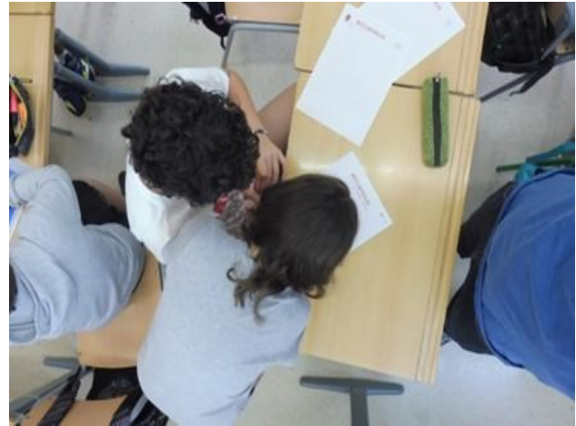
Figura 3. Redactando el artículo de opinión.

a quedar corta. Al final de la sesión cada grupo comentó lo realizado, se fijó la hora para el día siguiente y se recogieron los borradores realizados para ser digitalizados mediante “canva” y “word” por el equipo investigador. La verdad es que el proceso iba más rápido de lo esperado: en el caso de los pósteres el grado de cumplimiento en esa primera sesión fue bastante alto, lo mismo que con el artículo de opinión, el tríptico por su complejidad estaba todavía en una frase inicial. (ver Figura 3)