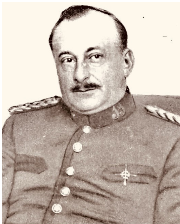
Miguel Primo de Rivera. Mundo Gráfico, 19-IX-1923

“Lo que sí he de aclarar es lo concerniente a nuestra presunta significación política. Periódicos hay que tratan de definirla. Es en vano señores. No representamos un gobierno de derechas ni de izquierdas. Sinceramente digo que no sé cuáles son las ideas políticas de mis compañeros de Directorio. Nunca hemos hablado de eso. En general, el ejército vive ajeno a la política (...) es lógica la semejanza de este Directorio con un gobierno de derechas, pero esto es circunstancial”. 2