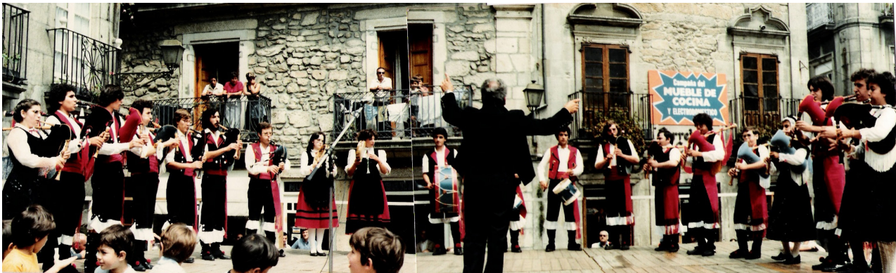
Fig 2. 1982 coa banda Raigames na Praza da Constitución en Vigo.