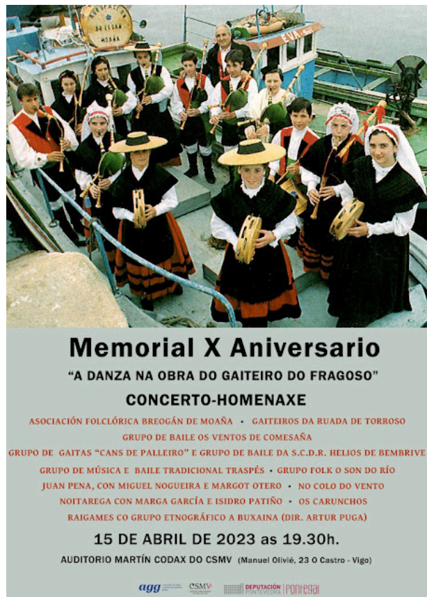
Fig 8. 2023 Cartel do Memorial X Aniversario.