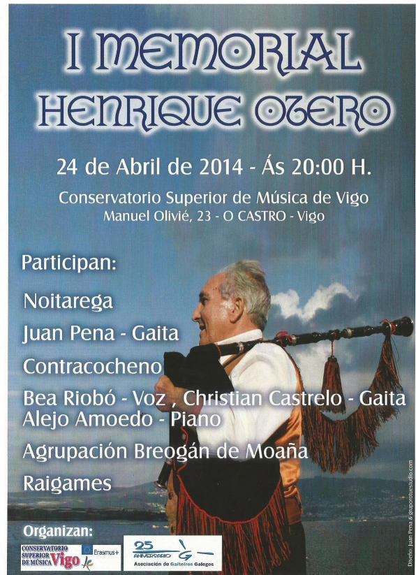
Fig 7. 2014 Cartel do primeiro memorial.