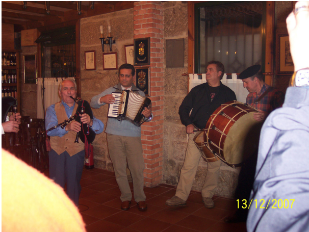
Fig 4. 2007 Gravando o programa Alalá no Catro Camiños en Gondomar.

Airiños do parque de Castrelos, Raigames (inédito), Muxicas, Treixadura, Manxadoira, A Subela, Xistra, Noitarega, Breogán, Ardentía, Robaleira,... ademais de, por suposto, as gravacións de Os Cruceiros e a súa propia monográfica.