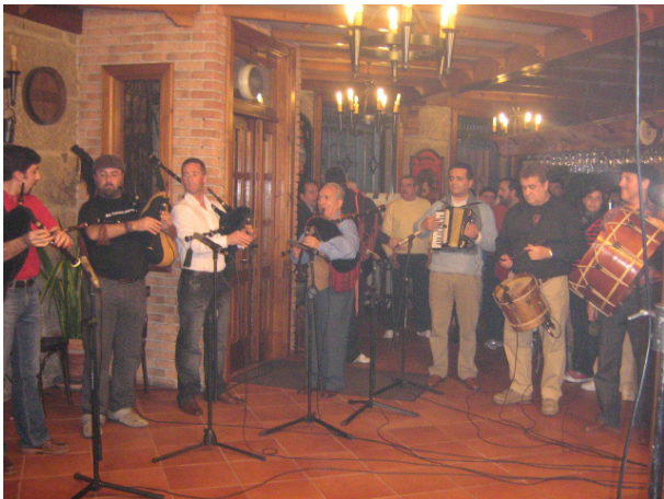
Fig 5. 2007 Gravando o programa Alalá no Catro Camiños en Gondomar.