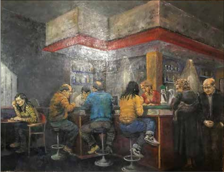
Escea de bar.