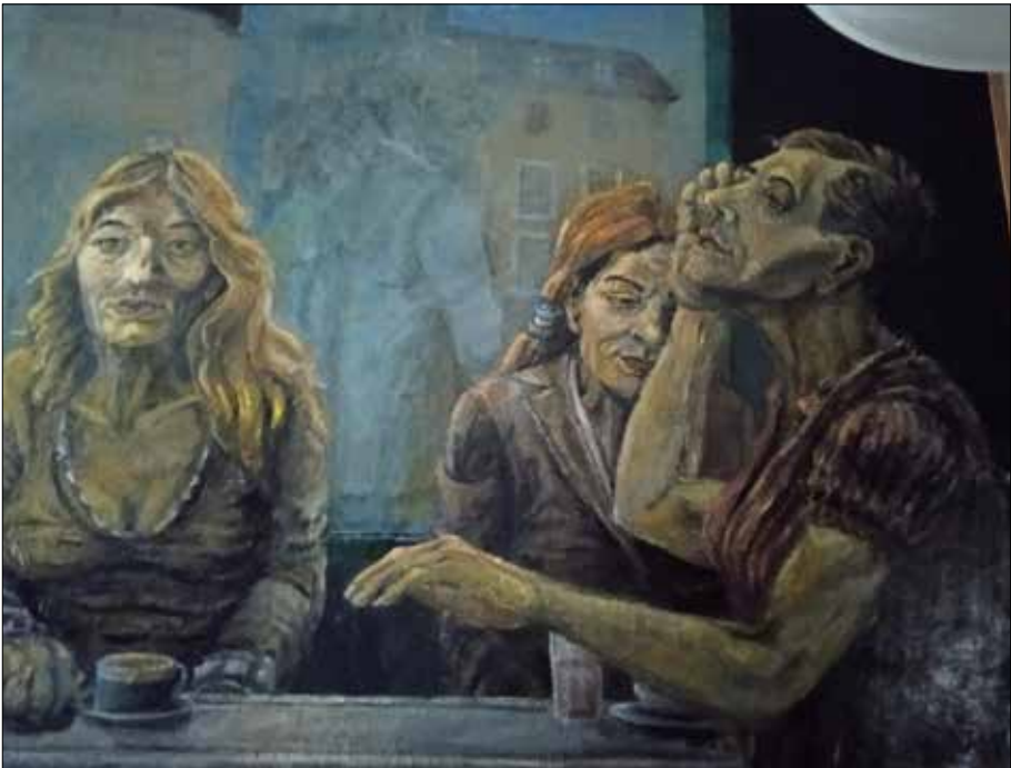
Sentada no bar.