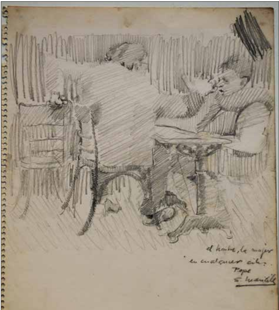
Estudo para “El hombre, la mujer en cualquier sitio”.

Os seus cadros ao miralos abren a túa imaxinación ata querer indagar na vida de cada un dos seus personaxes. Obsérvase como toman protagonismo sobre o lugar onde se sitúan, sendo estes como un pano de fondo sen importancia e case irreal. O individuo e as súas circunstancias e actitude prevalece. (cadros paseando cans, cadro da cidade)