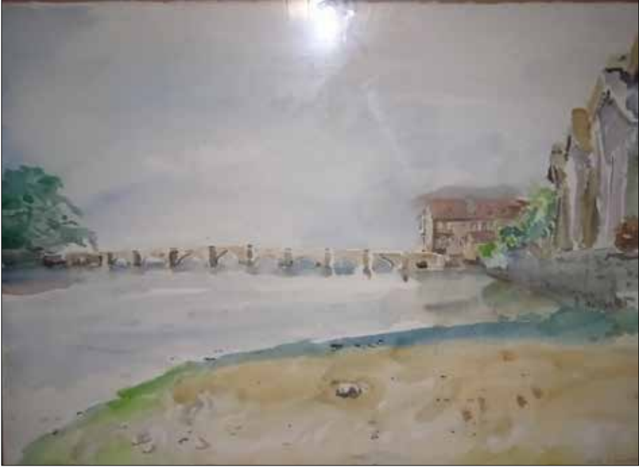
Ponte da Ramallosa (acuarela).