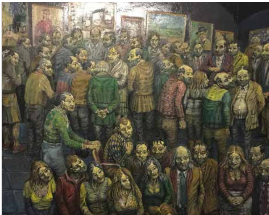
Museo en París.

neste outono de 2020, quedamos todos coa incógnita da súa evolución en tempos de COVID. Pechados bares, tascas e cafeterías, non sabemos como, pero a súa actividade seguirá sorprendéndonos.