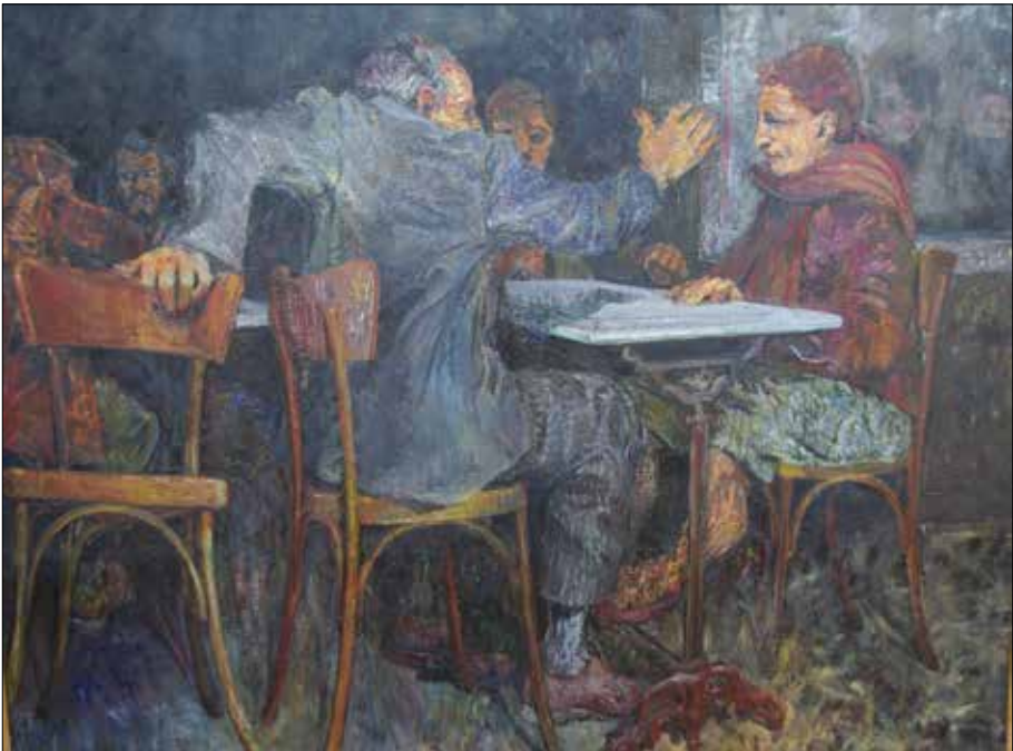
El hombre, la mujer en cualquier sitio (Óleo).