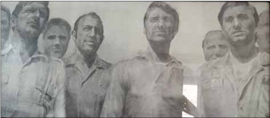
Grupo de amigos.

Quen teña que facer a biografía de Pepe Sanjurjo Mantilla non o terá fácil. Non se pode facer unha biografía completa, por non ser un tema ao que el preste dema-