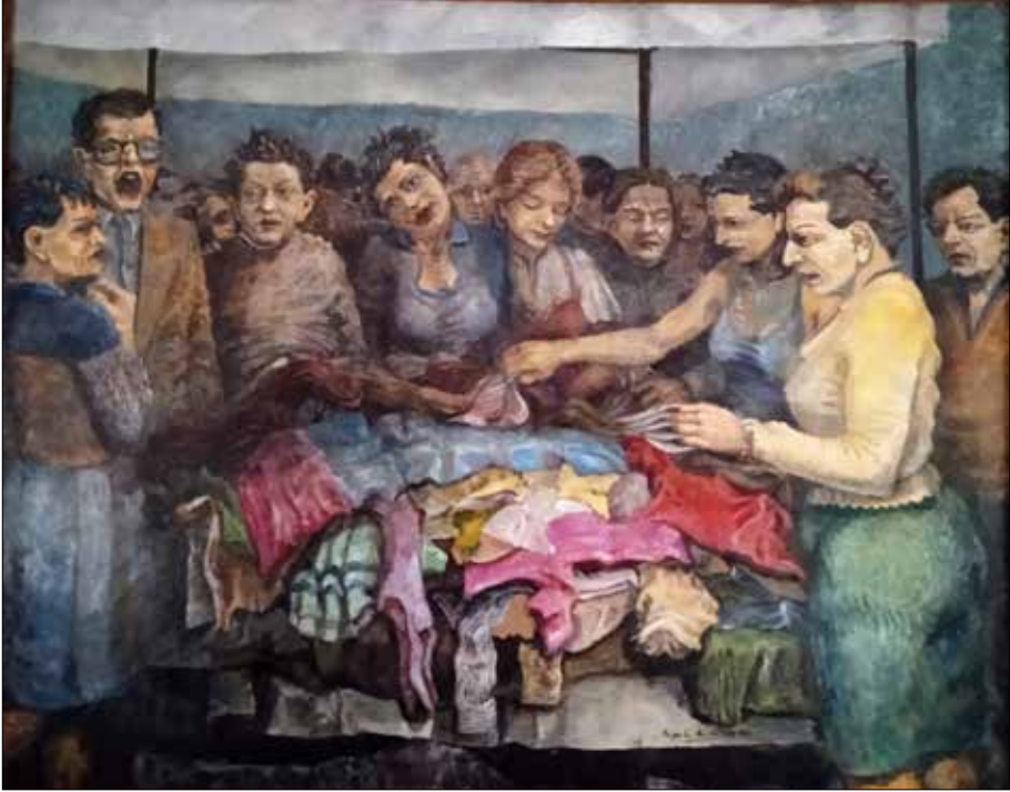
Mercado de Sabaris.