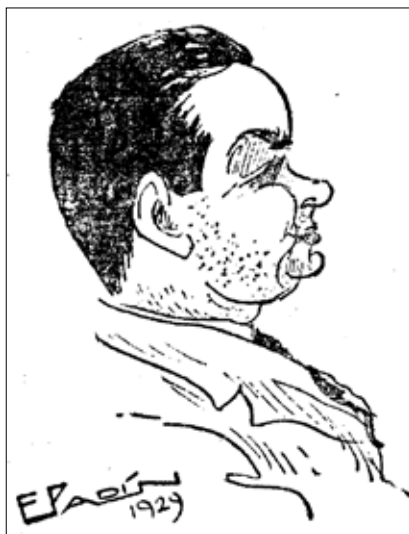
Calvo Sotelo. Faro de Vigo, 15 de maio de 1929.

É por iso que a capacidade financeira para o mantemento de certos servizos era a razón de ser da nova organización territorial. Nese sentido, o que a parroquia pretendía era obter os recursos necesarios para poder exercer o labor de goberno xa que, sen presuposto, a Entidade Local non tiña sentido. Todas as présas que metía Sabarís para institucionalizar a súa autonomía e os obstáculos que lle puña Baiona á mesma, tiñan que ver coa cuestión económica.