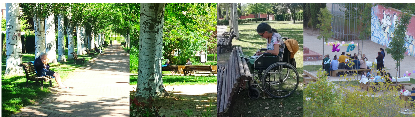
Figura 3. Escenas domésticas en Parque Alameda