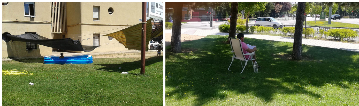
Figura 4. Escenas domésticas en zona verde de Huerta del Rey