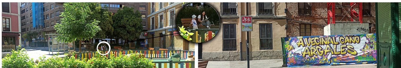
Figura 6. Escenas domésticas en la plaza Caño Argales