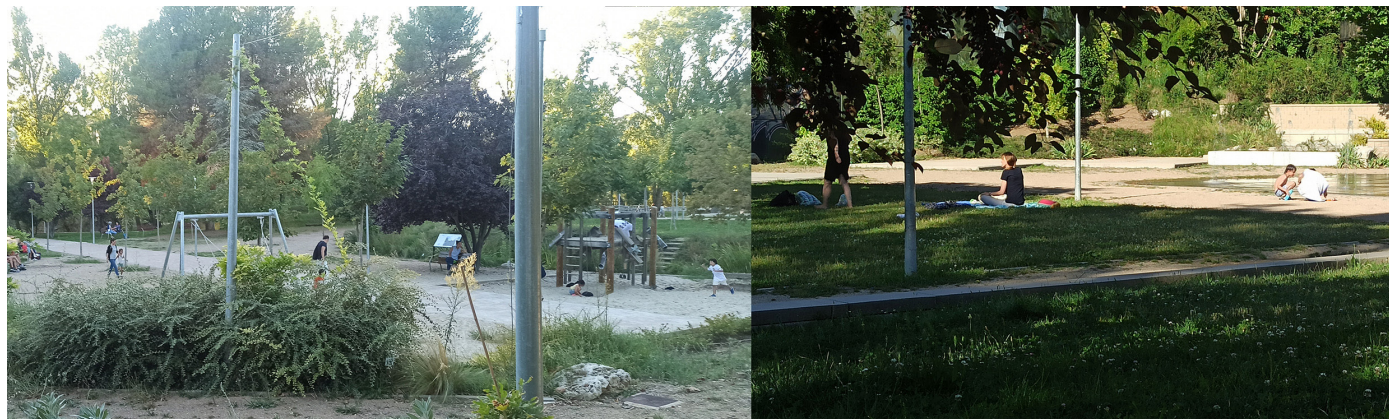
Figura 5. Escenas domésticas en el parque T.R. Bolaños

En el Parque Tomás Rodríguez Bolaños, 1ha totalmente reformada en 2019, con plantaciones y códigos de jardinería actuales, y relativamente delimitada de una zona verde más amplia (junto a la ribera del Pisuerga y muy próxima al principal eje de centralidad de la ciudad, Paseo Zorrilla), un domingo de junio, sobre las 12.30, una mujer madura pasea a un perro grande, lo suelta y juega a tirarle la pelota. Vive cerca y viene con frecuencia. Sabe ir cuándo hay poca gente para poder soltarlo, porque es consciente de que debería ir atado. A veces también viene con el nieto y es la razón que da para contarme que un día llamó al servicio municipal para quejarse de okupas en una de las casetas: “había cosas que no tenía por qué ver el niño, y rápidamente las clausuraron”; le gusta mucho el diseño. Se cruza con una pareja con un perrito, que también va suelto, y charlan. Un hombre lee en un banco. Un viernes de junio, sobre las siete de la tarde dos muje-