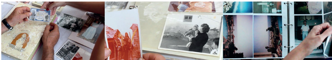
Figura 1. Título visual. Recogida de datos con video-evocación. Fotoensayo compuesto por tres fotogramas de la video-evocación realizada por la autora, de derecha a izquierda (abuelo y tía de la autora, 2018, padre de la autora, 2018, y madre de la autora, 2018). González-Agudo y García-Roldán (2022).

Somos, en la medida en la que nos representamos, y lo que recordamos ser.