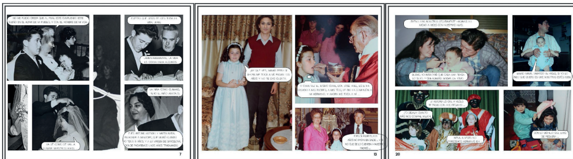
Figura 3. Relatos intergeneracionales de la fotonovela . Fotoensayo compuesto por tres pliegos de la fotonovela, 2018; de derecha a izquierda (narrativa de la boda de los abuelos de la autora, 1966, comunión de la tía paterna, 1981, nacimiento de la autora, 1995). González-Agudo y García-Roldán (2022).