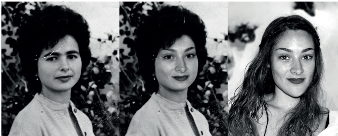
Figura 2. Procesado del morphing para la creación de un fragmento de la fotonovela. Fotoensayo compuesto por tres imágenes del proceso, de derecha a izquierda (retrato de la abuela de la autora, 1964, resultado del morphing , 2018, y retrato de la autora, 2017). González-Agudo y García-Roldán (2022).

al uso de estas técnicas en el contexto educativo y que están contenidas en el núcleo principal de la investigación de los autores. Por un lado, la creación de una fotonovela como narrativa para el reconocimiento de la identidad familiar, dentro del marco empírico del estudio predoctoral de la autora (González-Agudo, 2019). En dicho marco se analiza y pone en práctica distintas técnicas de apropiación y transformación digital sobre fotografías del archivo familiar desde una metodología de Investigación basada en Artes. Todo ello con el objetivo de deconstruir el ideario iconográfico personal y biográfico, poniendo en cuestión aquellas narrativas visuales que visibilizan la pertenencia y la representación del entorno familiar más próximo (figs. 1-4). Y, por otro lado, la consecuencia de su aplicación en un contexto educativo de formación universitaria con estudiantes de la mención de Diseño del Grado en Bellas Artes de la Universidad de Granada durante el curso 2021-22 (figs. 5-7).