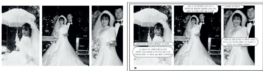
Figura 4. Transformación digital e interpretación de una escena del archivo familiar. Fotoensayo comparativo de originales del archivo familiar y resultados de la fotonovela una vez aplicada la técnica de morphing ; derecha (secuencia de fotografías originales de la boda de los padres de la autora, 1988), izquierda (secuencia narrativa de la fotonovela con la aplicación del morphing sobre el rostro de la madre, 2018). González-Agudo y García-Roldán (2022)..

Todo el trabajo recopilado en este artículo se inscribe dentro de una Investigación basada en las Artes, Art Based Research (ABR), que hace uso de los procesos y resultados artísticos como parte esencial de los contenidos propios de la investigación, incorporando un enfoque a/r/tográfico que nos permite plantear nuevos escenarios para su aplicación. La A/R/Tografía es una forma de entender el arte y sus concreciones socio-educativas, aludiendo al mismo tiempo a la teoría, a la práctica y, además, a las decisiones que se toman en el propio proceso. En ella el artista no solo investiga su propio devenir estético, sino que también es el precursor de nuevas orientaciones en el ámbito educativo, ya que pone de manifiesto una relación simbiótica entre el profesor, el docente y el artista.