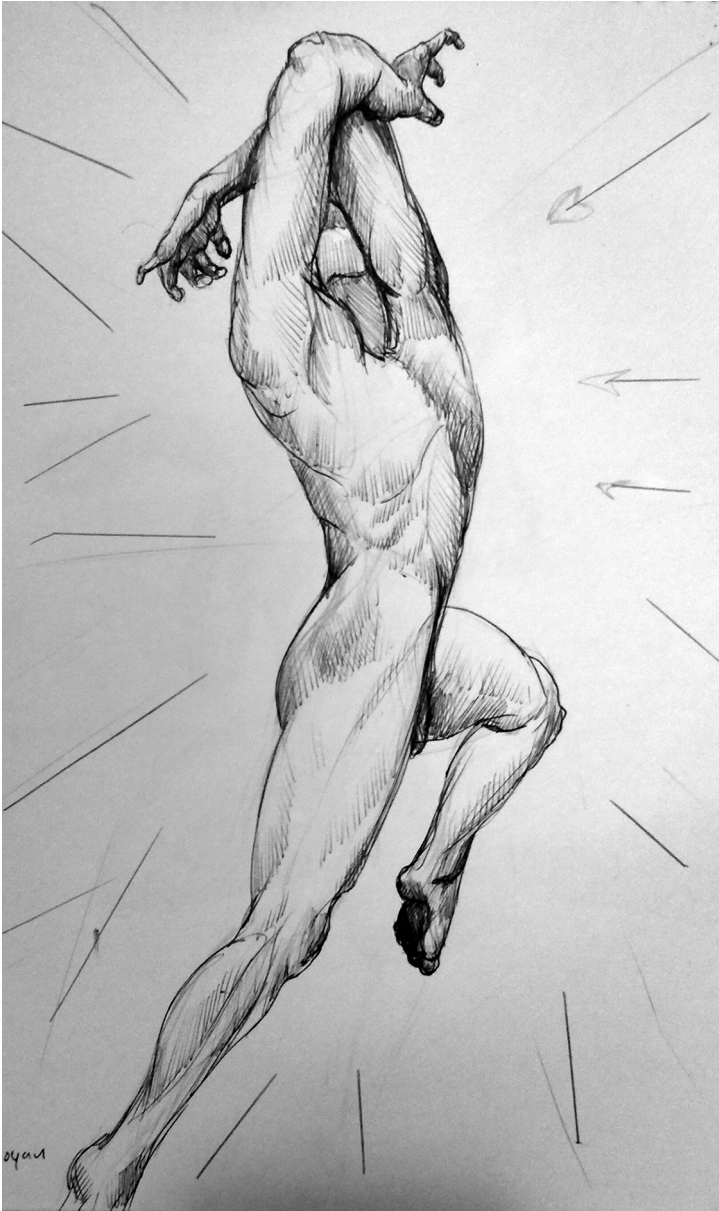
Sin título (2015). Técnica boligrafía: Ulises Gutiérrez-Bonilla Prohibida su reproducción en obras derivadas.