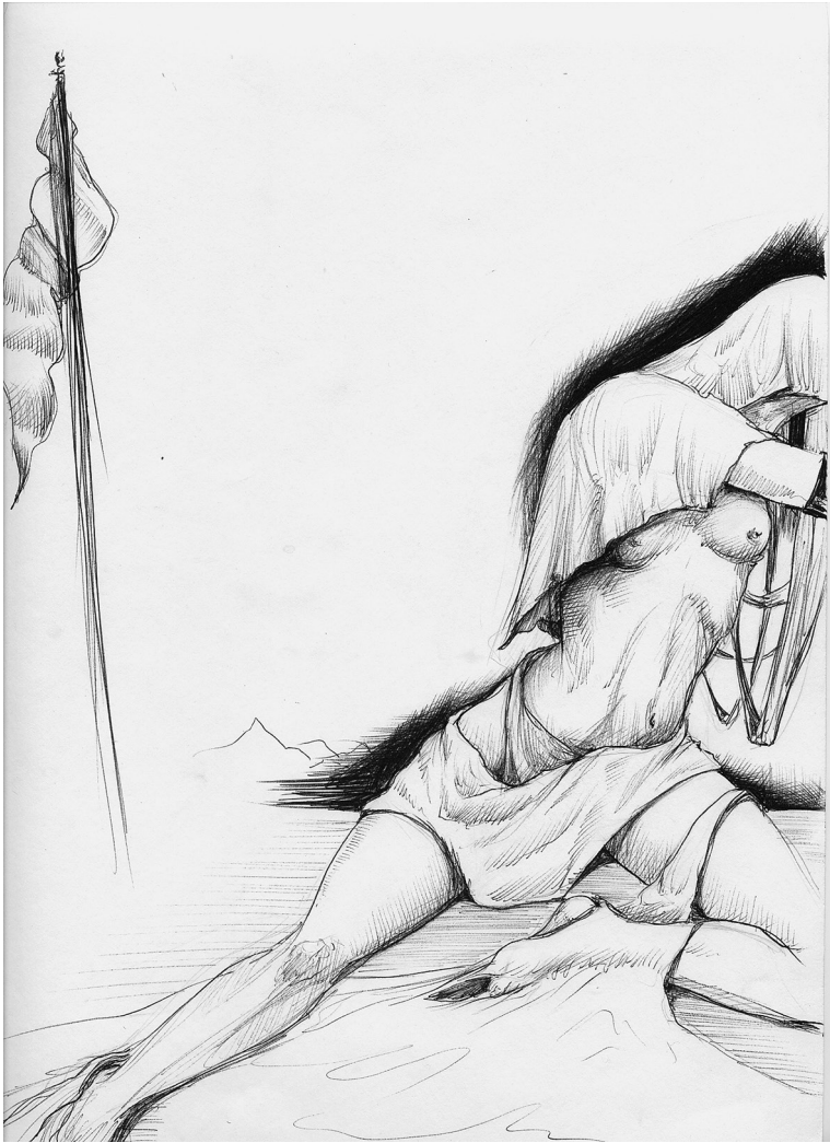
Sin título (2015). Técnica boligrafía: Ulises Gutiérrez-Bonilla Prohibida su reproducción en obras derivadas.