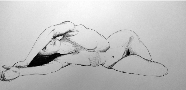
Sin título (2016). Técnica boligrafía: Ulises Gutiérrez-Bonilla

De tu soledad a mi boca transitas, del aburrimiento domesticado a la diosa promesa inmor[t]al con saliva de ira y alivio. Mi pupila, de pájaro, te inaugura y conserva; la lengua balbucea un verso lejano con voz de mariposa. Tú, cuelgas metáforas en la luna, y hablas en violeta. Nublados femeninos surgen desde el centro de tus pies, y habitas atrás del sol. Por fin, envejeces poemas y relojes en tus piernas de amada, y yo inclino la cintura de la luna mientras mis manos de miel dan claridad a la ancha muerte. Ahora, lejos de la orfandad del aire, el humo precede la escritura y las palabras asoman cicatrices.