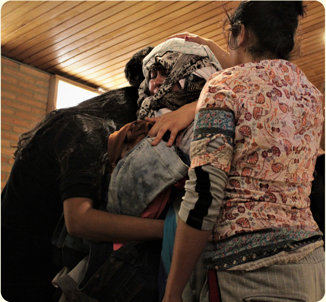
Fotografía del Taller Danza de las Emociones, proyecto TransMigrARTS , UDFJC