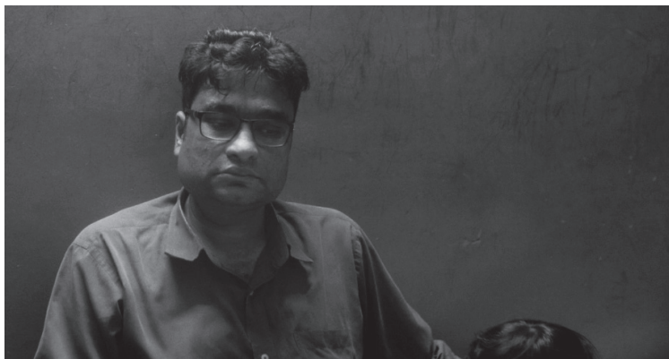
Fotograma 1. Imagen del documental "All that breathes" (2022) Dirección Shaunak Sen

Al abordar los referentes mencionados, parece, de primeras, especialmente abrumador comprenderlos en su entereza y buscar inspiración del producto dentro del gran esquema creativo que comprende la producción de un largometraje de las proporciones mencionadas. Por esto, se tomaron observaciones técnicas relativas a la forma y no al fondo de los documentales analizados. En ello, se observan factores relativos al color, composición, introducción de los personajes y la forma en la que se agregan los elementos extradiegéticos como los tituladores y los gráficos.