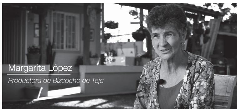
Fotograma 3. Imagen del documental “Migajas de la Tradición” (2023) Dirección Juan Daniel Escobar.