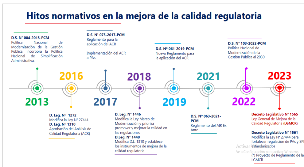
Figura 2. Hitos normativos de la mejora de la calidad regulatoria

Nota, Muestra la cronología la mejora de la calidad regulatoria en Perú desde el 2013 al 2023.