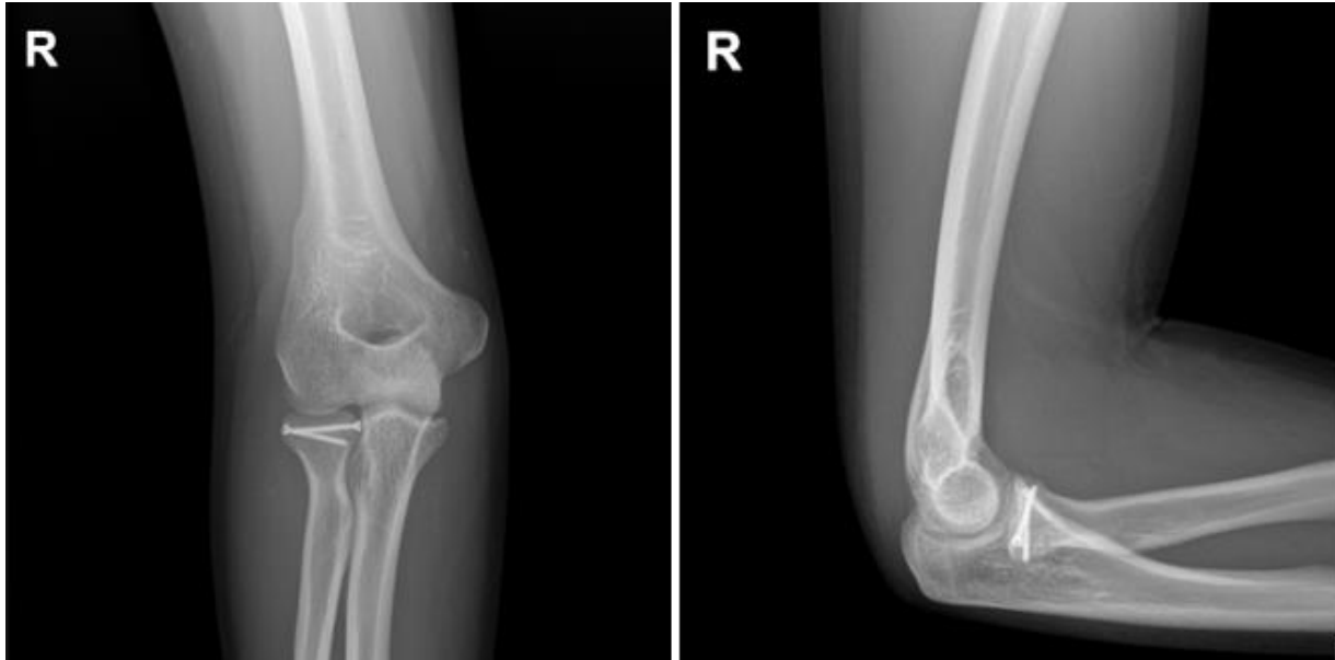
Figura 2. Radiografía anteroposterior y lateral de codo de control. Se observa la fijación con 2 tornillos.

Se programó una revisión para el día 21, durante la cual se retiró la férula y se observó una buena cicatrización. Se evidenció que los rangos de movimiento activo (AROM) del codo estaban reducidos (flexión: 90°, extensión: 60°), con limitación en la supinación y pronación. Se indicó terapia física, así como el uso de antiinflamatorios no esteroides (AINEs) por vía oral para el manejo del dolor. Además, se programaron controles mensuales con el fisiatra. El paciente mostró una evolución positiva, y al sexto mes, se observaron rangos de movimiento normales (flexión: 140°, extensión: 0°) sin limitaciones en la pronación y supinación. (Figura 2).