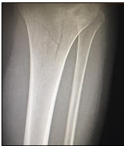
Tomografía Computarizada de rodilla

Imagen 1. Fractura de fractura de la meseta tibial