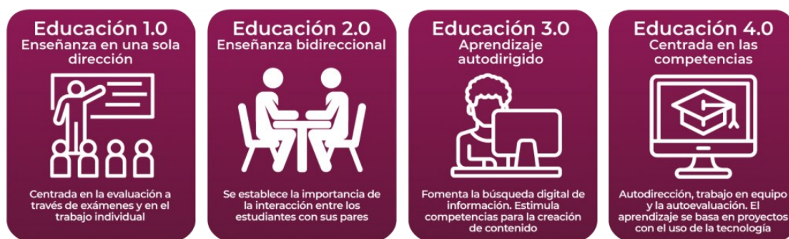
Figura 1: Evolución de la educación.