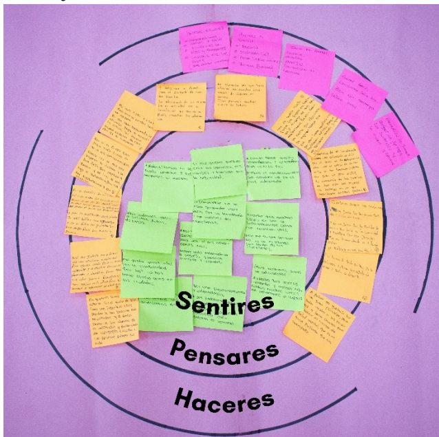
Figura 5. Percepciones de sentires, pensares y haceres de los estudiantes de la Institución Educativa de Sincelejito

Ante esto, los estudiantes sienten el desarraigo de los docentes hacia el territorio: “los profesores en su mayoría vienen de otros lugares y no se quedan en el pueblo, se quedan en la cabecera municipal de Ayapel y a mitad de semana se van”; “la educación en Sincelejito es anticuada, no innovan en sus métodos”; “la educación es fácil, aquí no se exige mucho”; “es re-fácil, aquí nadie pierde el año, si no vienes, no pasa nada”; “no me gusta la educación de aquí, no se ve interés de los profes”. (Comunicación personal - estudiantes, 19 de mayo de 2023).