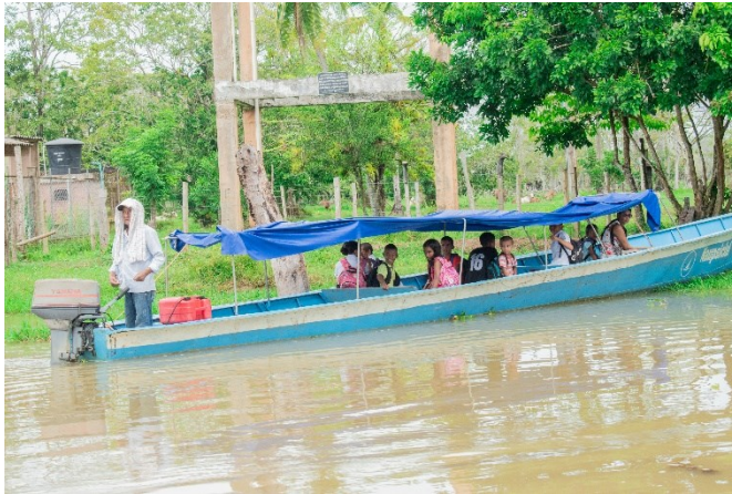
Figura 4. Transporte escolar en Sincelejito