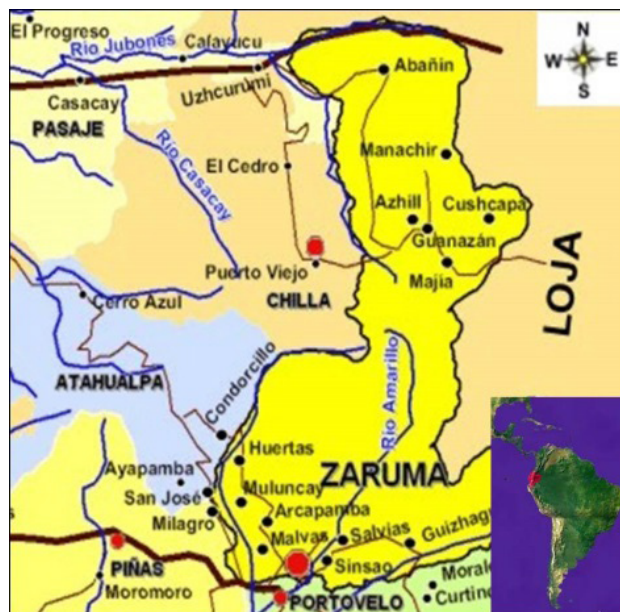
Figura 1. Ubicación geográfica del lugar en experimento.