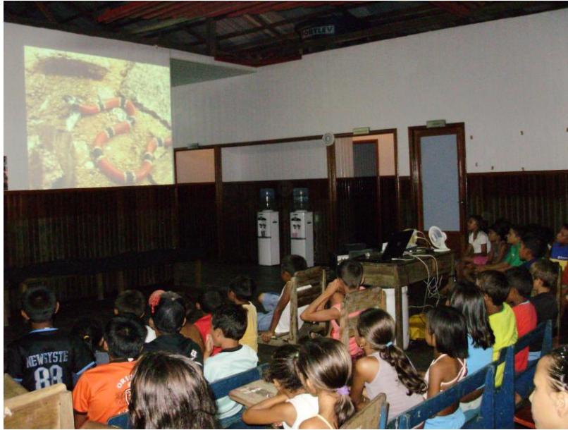
Figura 3. Palestra sobre serpentes e acidentes ofídicos na comunidade Cuiuanã, Reserva Piagaçu-Purus, Amazonas, Brasil.