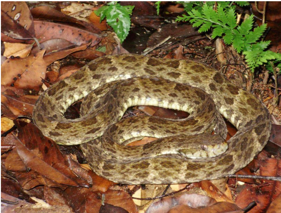
Figura 2. Bothrops atrox a serpente mais envolvida em acidentes ofídicos na Reserva Piagaçu-Purus, Amazonas, Brasil.

Apesar da alta diversidade encontrada nessa região, com 44% (12 spp.) das 27 espécies de serpentes peçonhentas com ocorrência na Amazônia brasileira (SILVA e RODRIGUES, 2008; CAMPBELL e LAMAR, 2004; SANTOS et al. , 1995), uma única espécie Bothrops atrox (Fig. 2) respondeu pela maioria dos acidentes nas comunidades da RDS-PP (WALDEZ e VOGT, 2009). B. atrox é a principal serpente de interesse médico da região Norte do Brasil (Borges et al. , 1999; Santos et al. , 1995) e maior causadora de acidentes letais na América do Sul (Gutiérrez et al. , 2006).