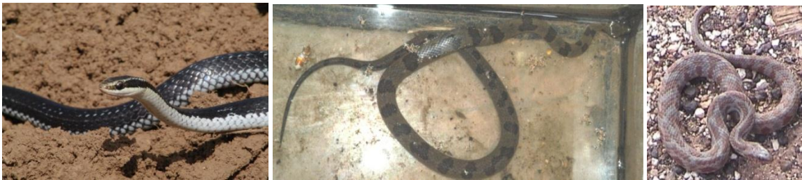
Figura 3. De izquierda a derecha: Caraiba andreae y Tretanorhinus variabilis; Nerodia clarkii