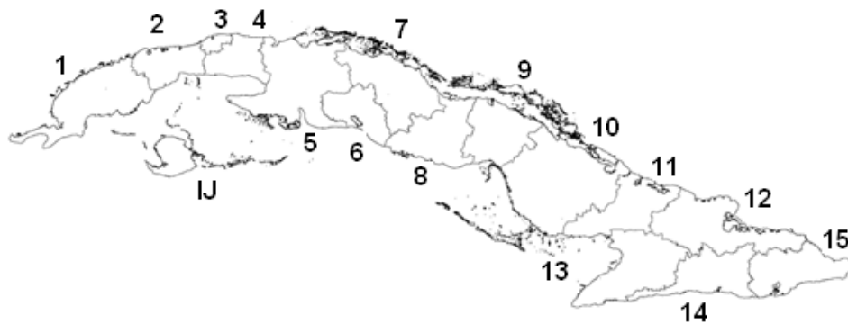
Figura 1. División político-administrativa actual. Provincias: 1, Pinar del Río; 2, Artemisa; 3, La Habana; 4, Mayabeque; 5, Matanzas; 6, Cienfuegos; 7, Villa Clara; 8, Sancti Spíritus; 9, Ciego de Ávila; 10, Camagüey; 11, Las Tunas; 12, Holguín; 13, Granma; 14, Santiago de Cuba; 15, Guantánamo; IJ, municipio especial Isla de la Juventud.

En la lista que se ofrece a continuación se relaciona primero la provincia en mayúsculas sostenidas y el municipio con mayúscula inicial, después la localidad lo más precisa posible, el número actual de la Colección de la Academia de Ciencias (CZACC), que se inicia con el número 4 que identifica a los reptiles, después un punto y la numeración que le corresponde a cada ejemplar; a continuación, la fecha y el o los recolectores; el número que poseía el ejemplar en colecciones anteriores donde se encontraba depositado: AC (Academia de Ciencias), IB (Instituto de Biología), IZ (Instituto de Zoología), todas en La Habana; por último, el estado de conservación, que se escribe como B (bueno), con alguna anotación si la necesitara, o M (malo). Los nombres de localidad, provincia y municipio se refieren según la división político-administrativa actual (GACETA OFICIAL DE LA REPÚBLICA DE CUBA, 2010) (Fig. 1).